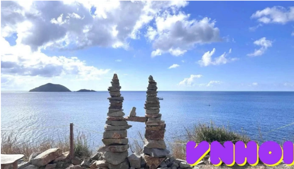
Chi?u hoang hon con ??o ba r?a v?ng tau