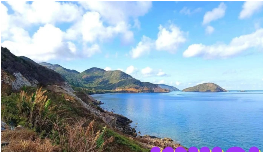
Chieu hoang hon con dao nui