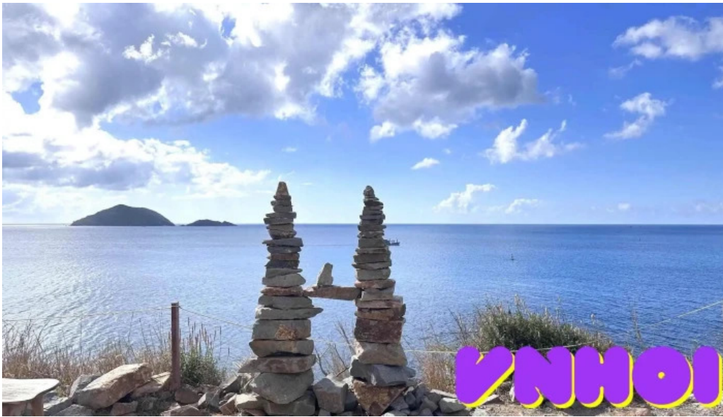
Chieu hoang hon con dao tat ca