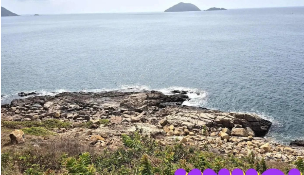
Chieu hoang hon con dao moi nhat