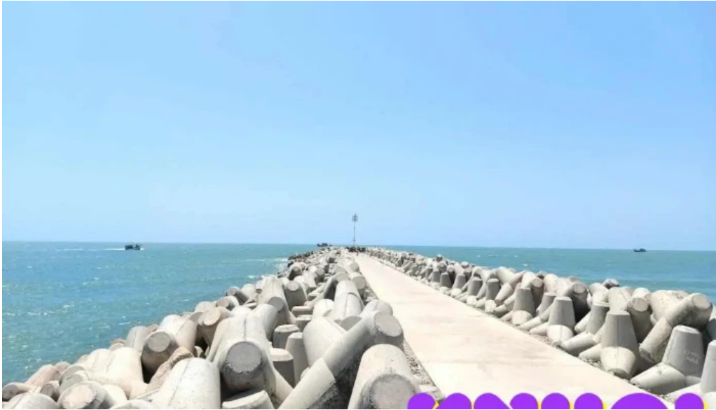
B? ke l?c an ba r?a v?ng tau