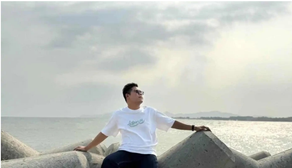
Bo ke loc an moi nhat