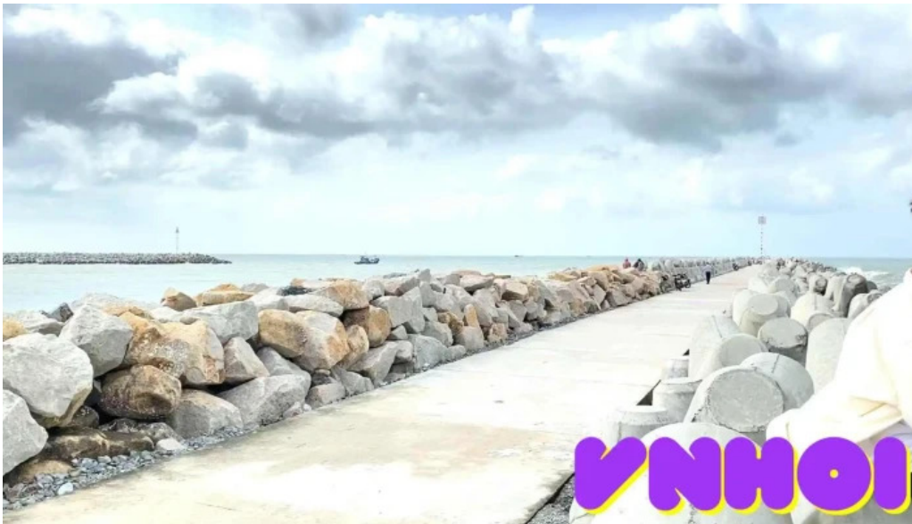
Bo ke loc an video