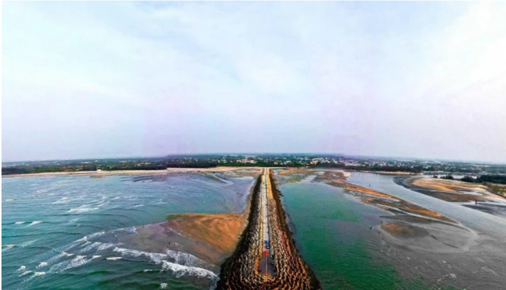
Bo ke loc an che do xem pho va 360deg