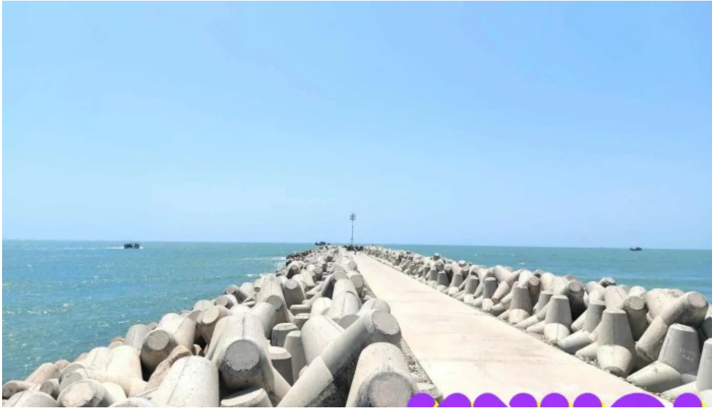
Bo ke loc an tat ca