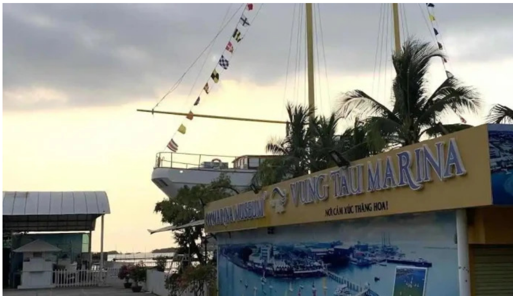
Ben thuyen vung tau marina moi nhac