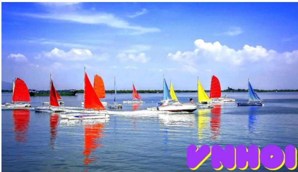
Be?n thuy?n v?ng tau marina ba r?a v?ng tau