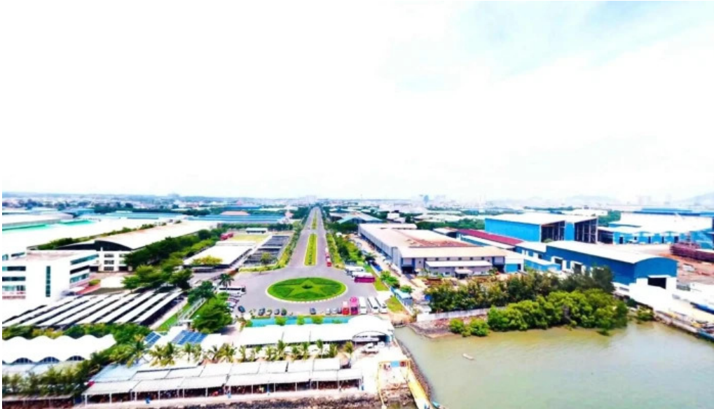
Ben thuyen vung tau marina che do xem pho va 360deg