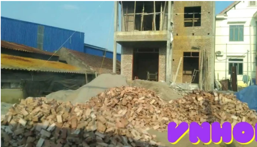
Dong tao video