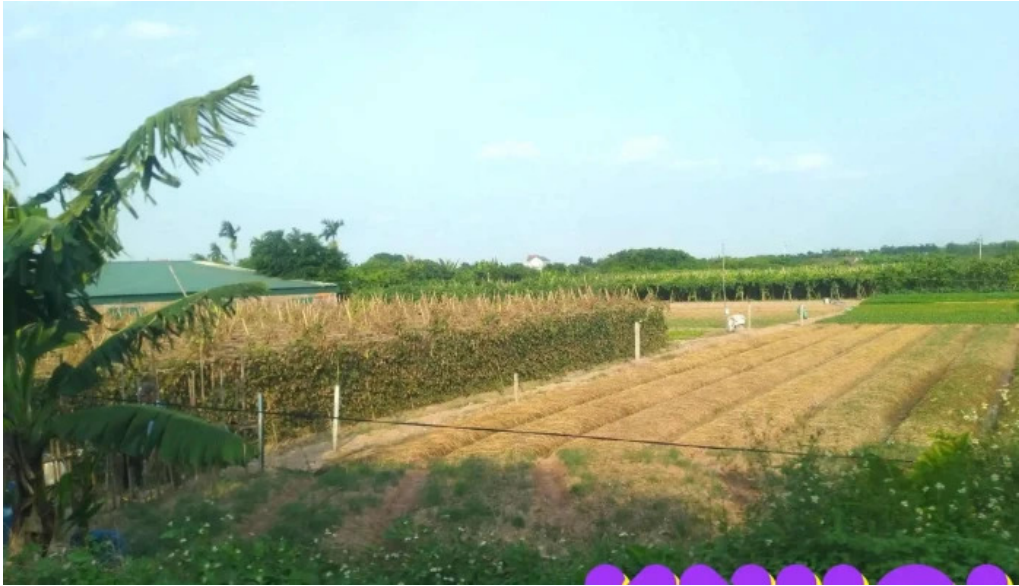
Dong tao tat ca