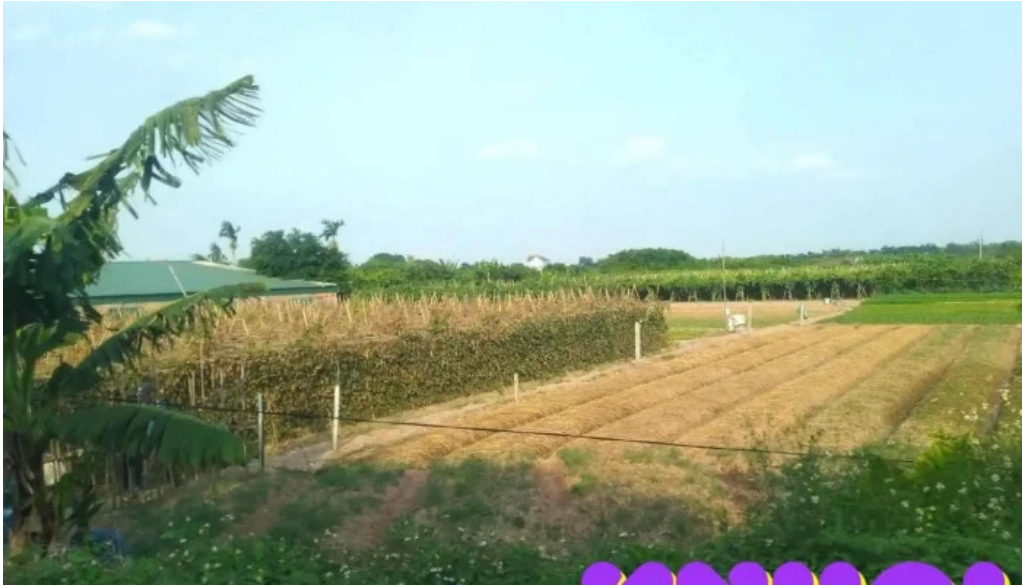
?ong t?o h?ng yen