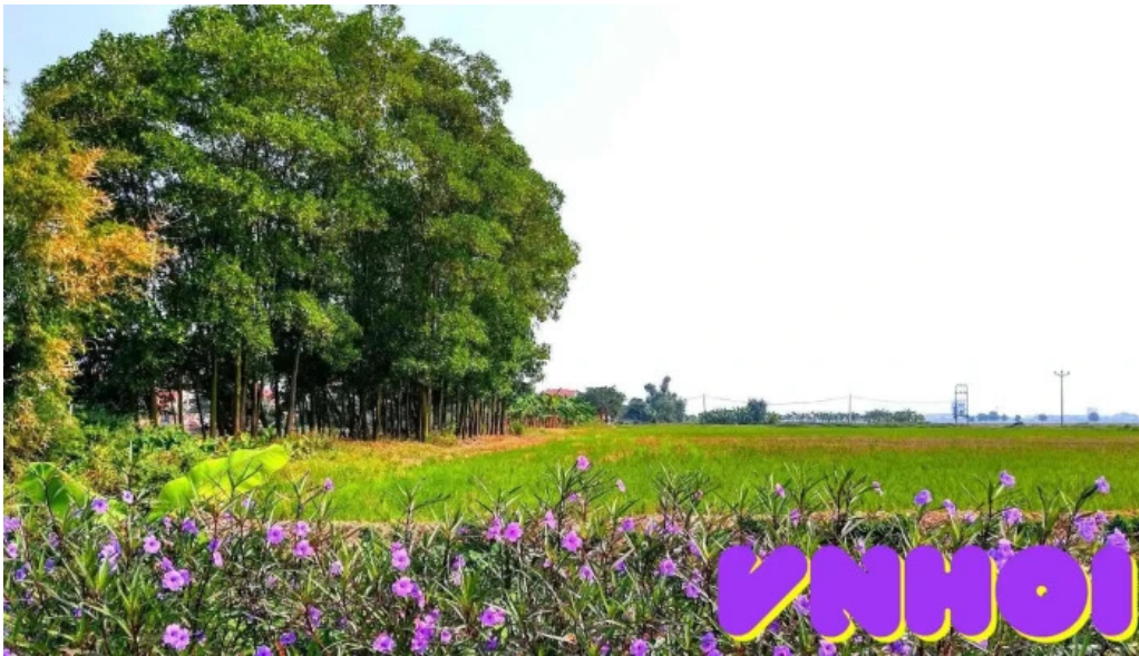
Van du h?ng yen