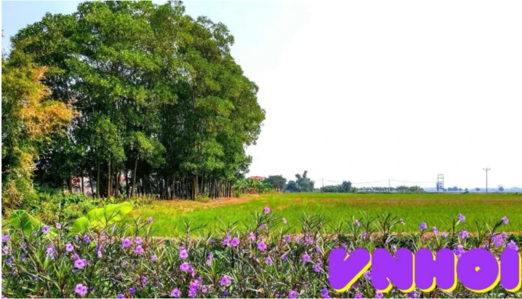
Van du tat ca