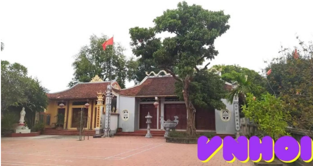
Du m? h?ng yen