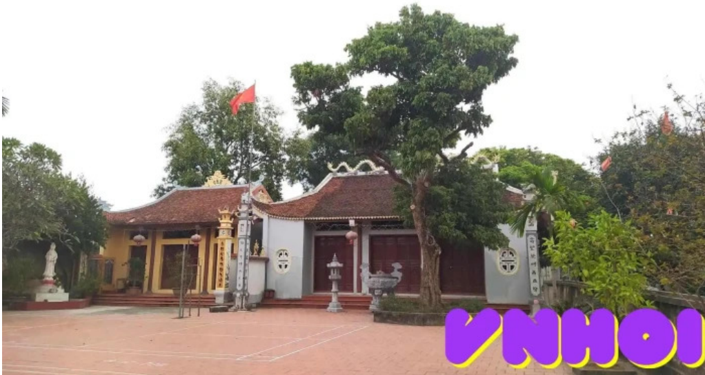
Du my tat ca