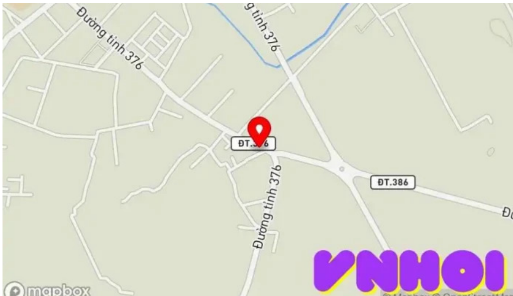
An thi b?n ??