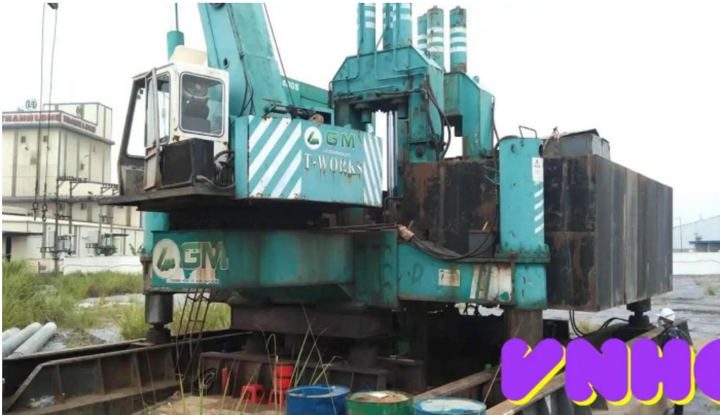
An thi tat ca