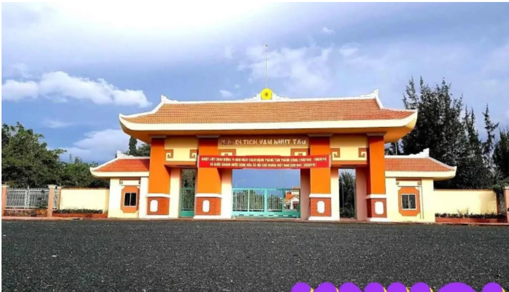
Khu di tích l?ch s? v?m nh?t t?o long an