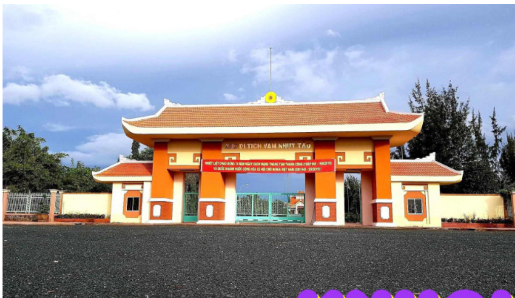
Khu di tích lịch sử vạm nhứt tao tất cả