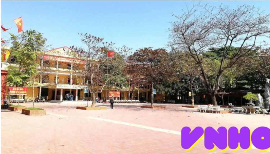
Thanh co hung yen truong thpt hung yen