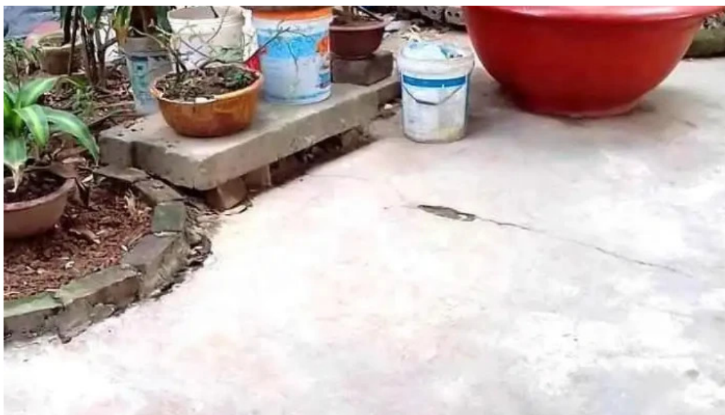
Thanh co hung yen video