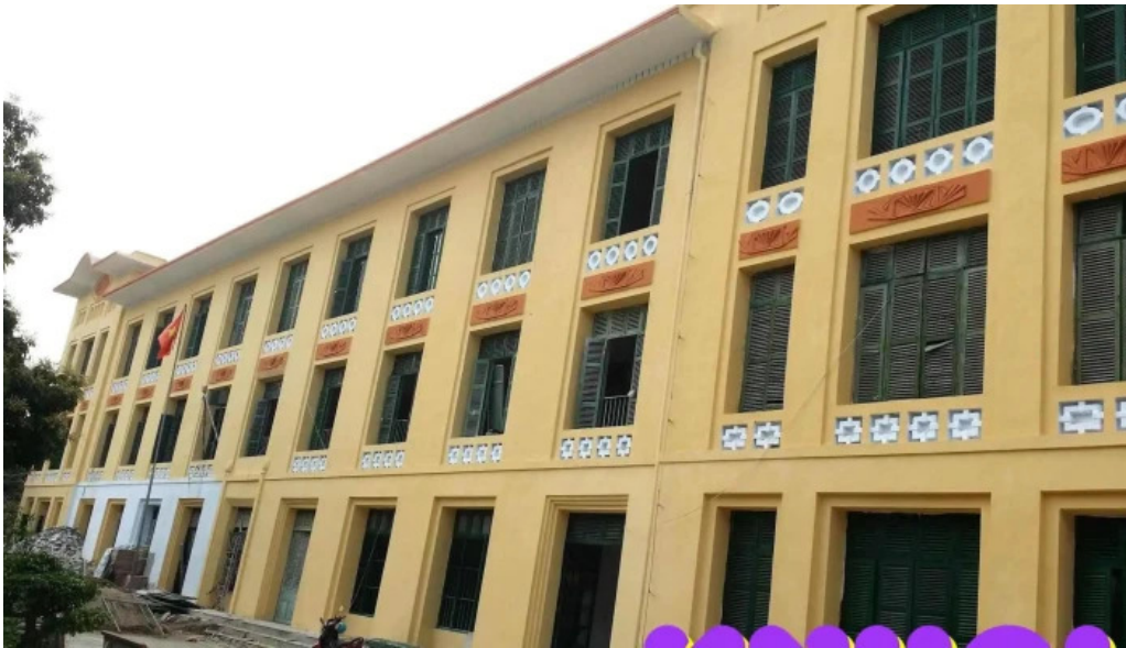
Thanh co hung yen tat ca