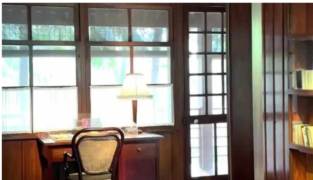
Nha san bac ho moi nhat