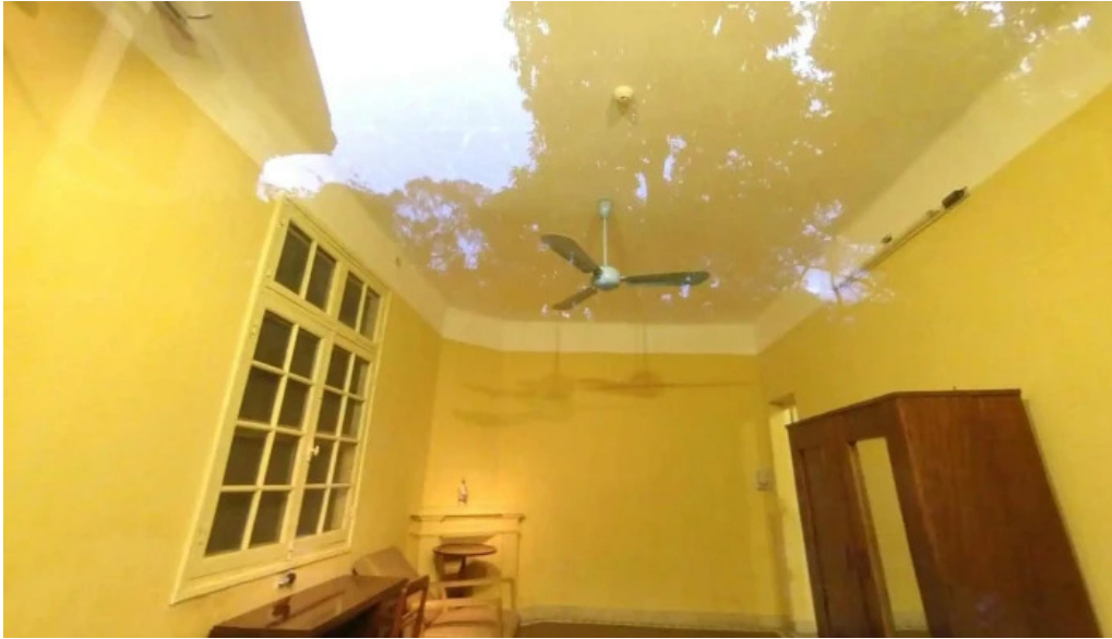
Nha san bac ho che do xem pho va 360deg