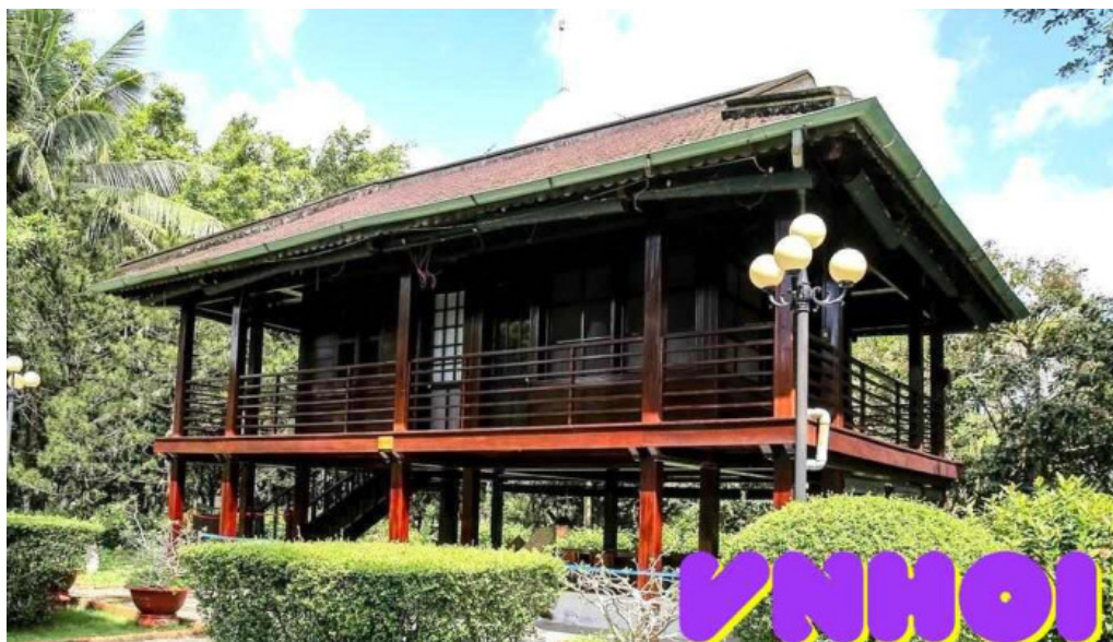
Nha san bac ho tat ca