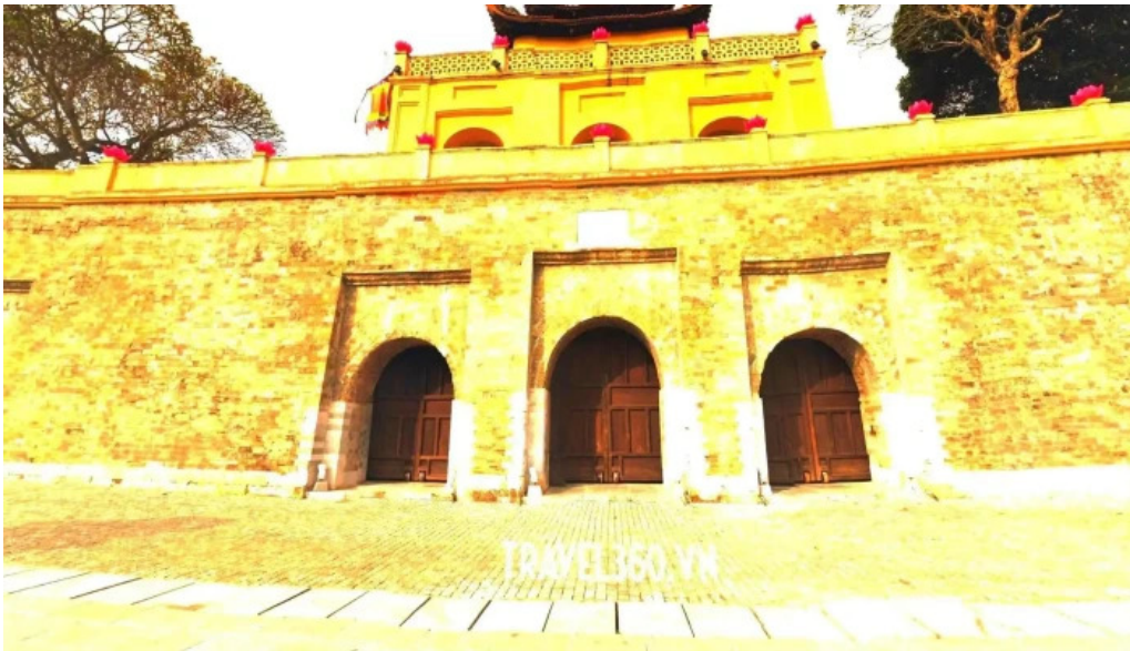
Hoang thanh thang long che do xem pho va 360deg