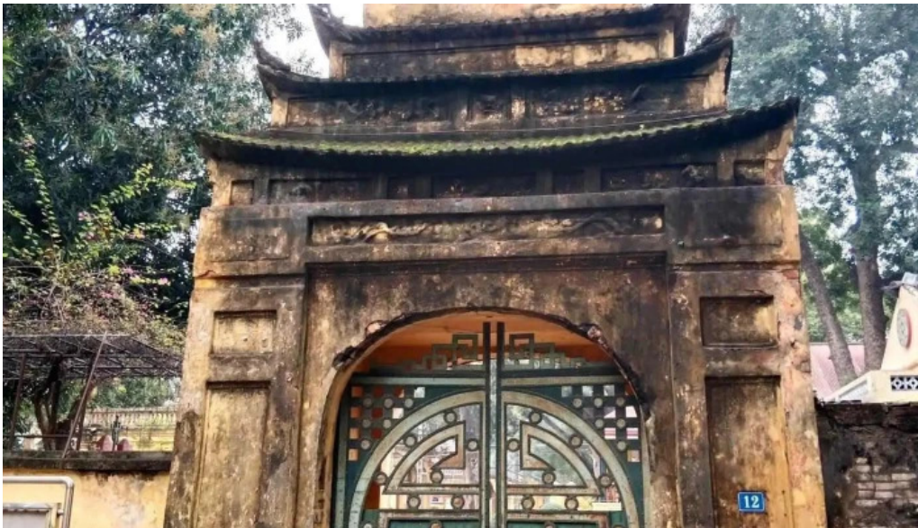
Hoang thanh thang long moi nhat