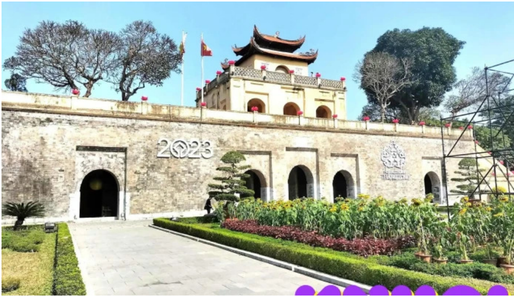
Hoang thanh thang long tat ca