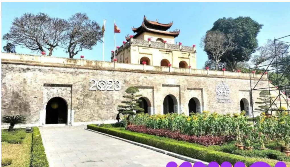
Hoàng thành th?ng long hà n?i