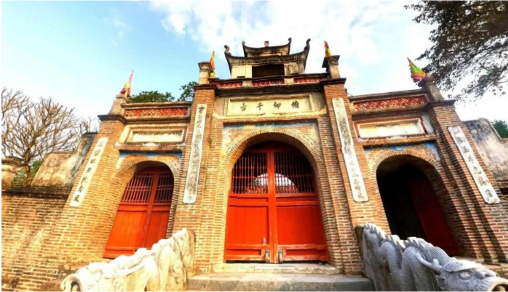
Di tích thành cổ loa che do xem pho va 360deg