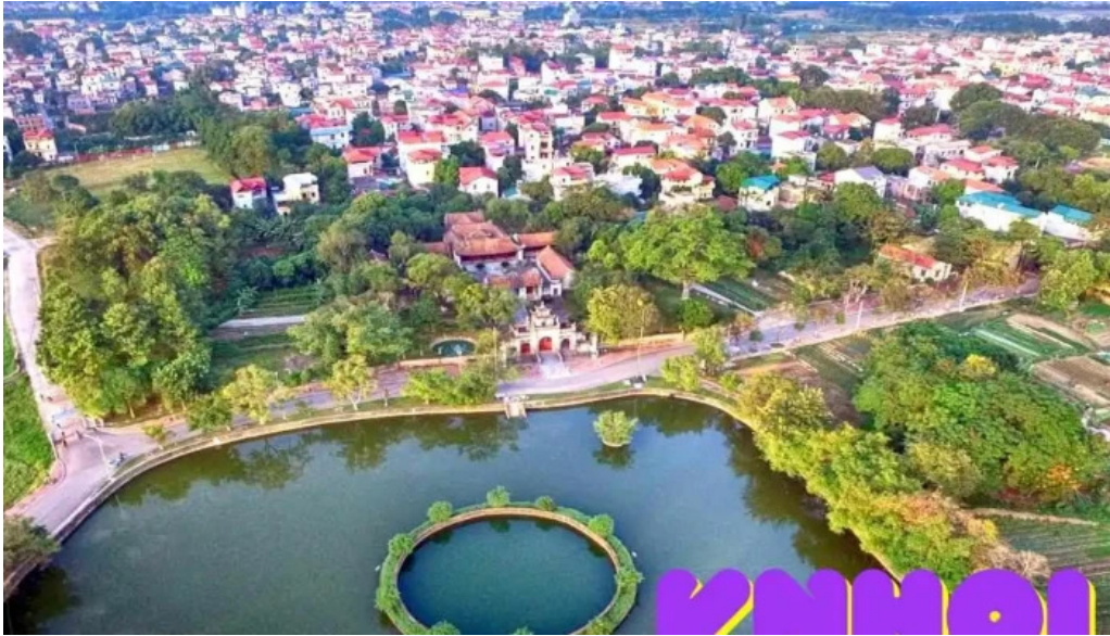
Di tích thành cổ loa tất cả