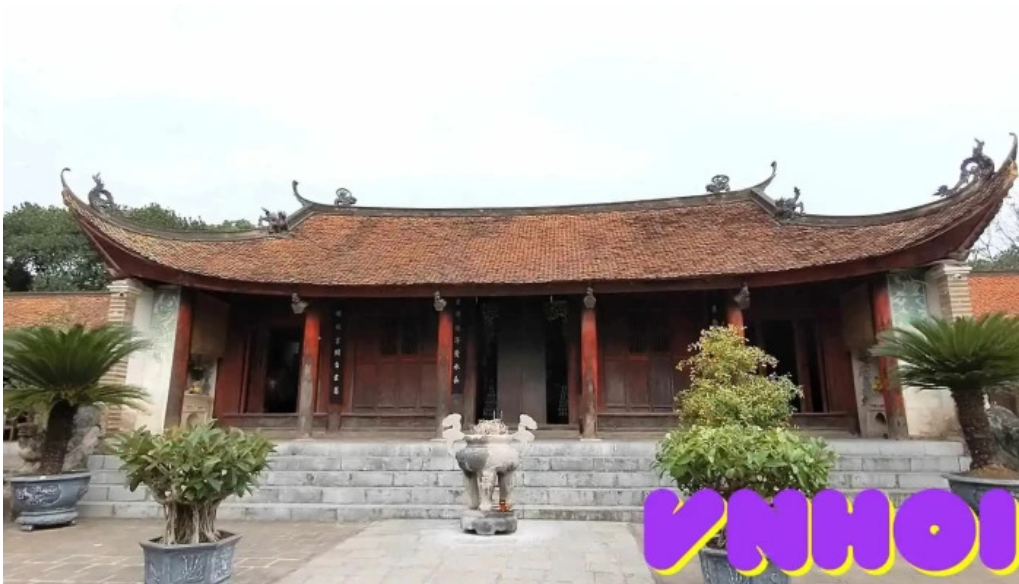
Di tích thành co loa video