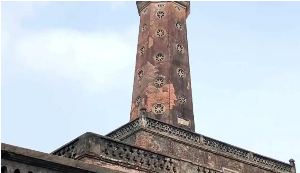
Cot co ha noi moi nhat