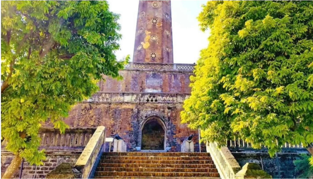
Cot co ha noi tat ca