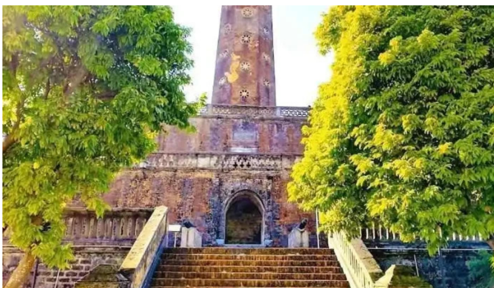
C?t c? ha n?i ha n?i