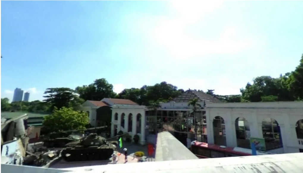
Cot co ha noi che do xem pho va 360deg