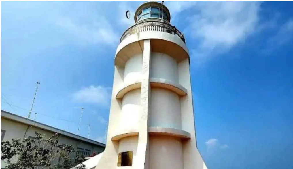
H?i ??ng v?ng tau ba r?a v?ng tau