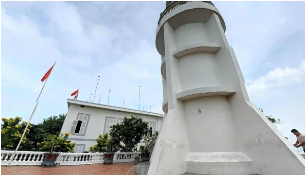
Hai dang vung tau che do xem pho va 360deg