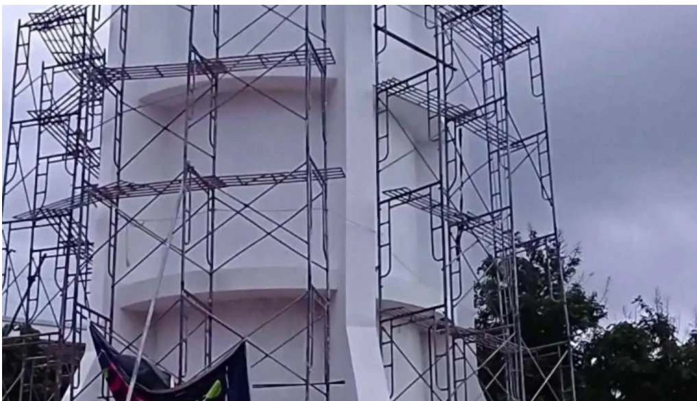
Hai dang vung tau video