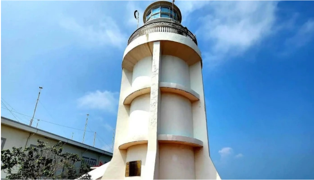
Hai dang vung tau tat ca