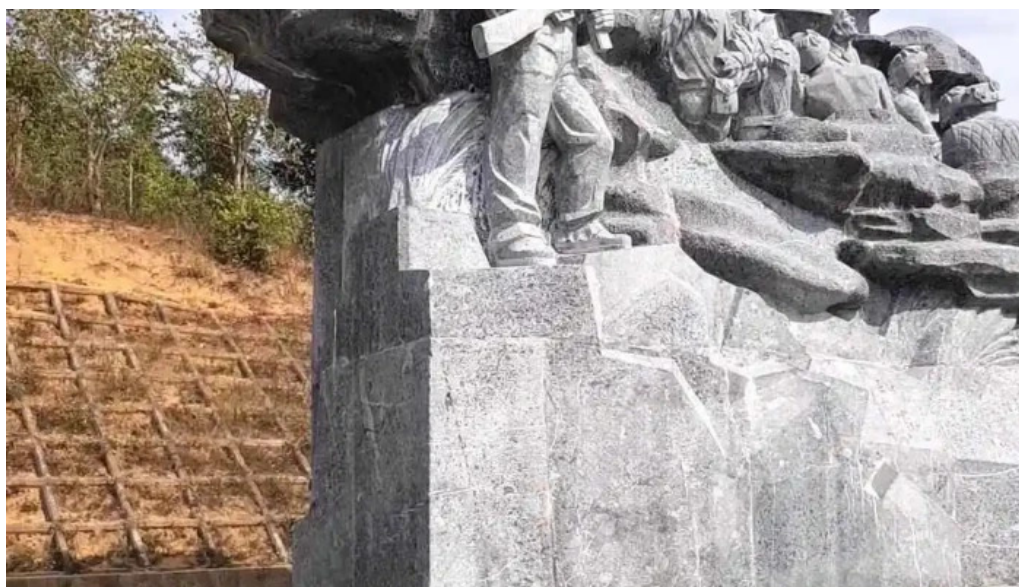
Tượng đại kéo pháo video