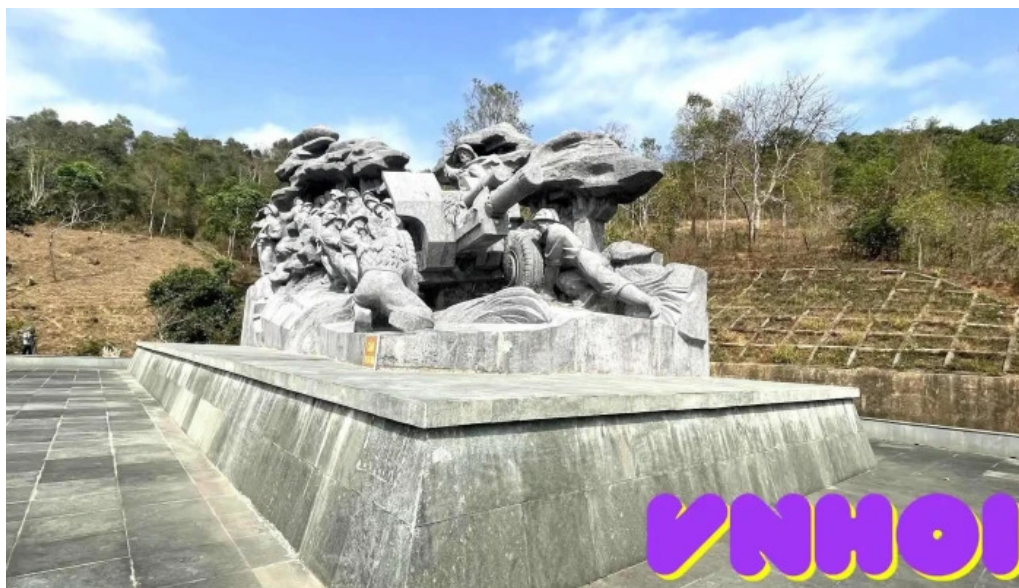
Tượng ai kéo pháo ở biên