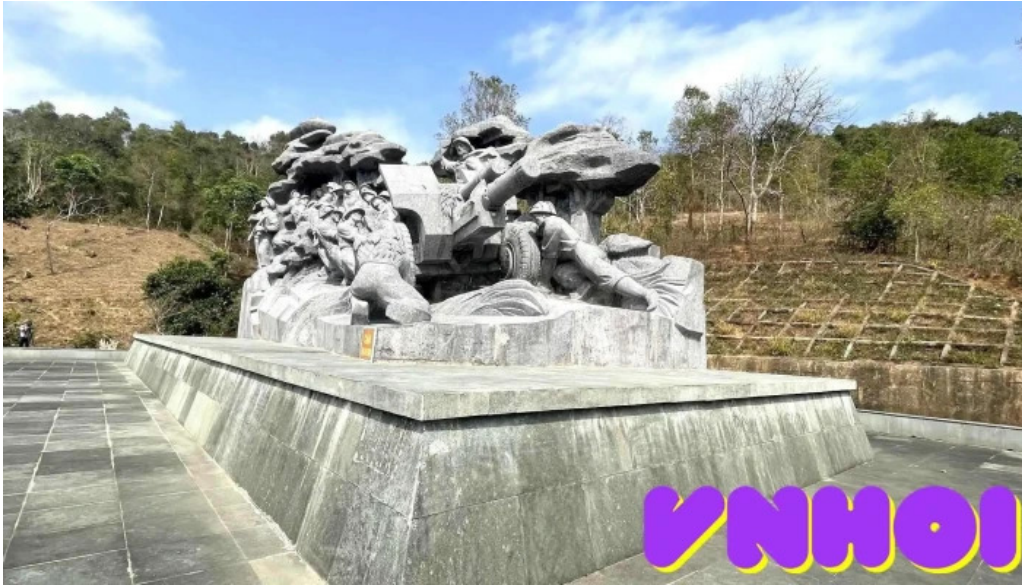
Tuong dai keo phao tat ca