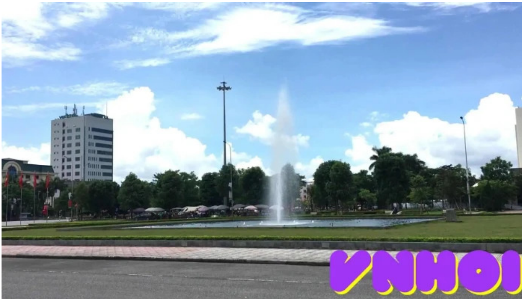
Ảnh phun nước quảng trường Hưng Yên video