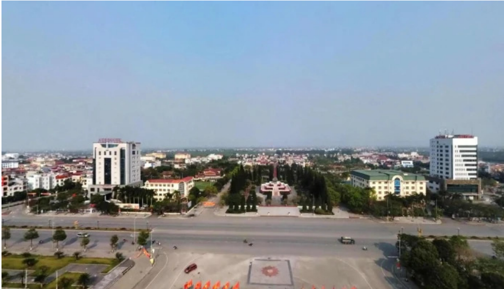
Dai phun nuoc quang trung hung yen che do xem pho va 360