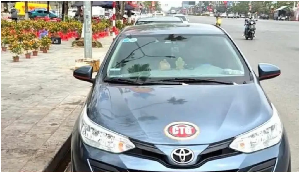
Dai phun nuoc quang truong hung yen moi nhat