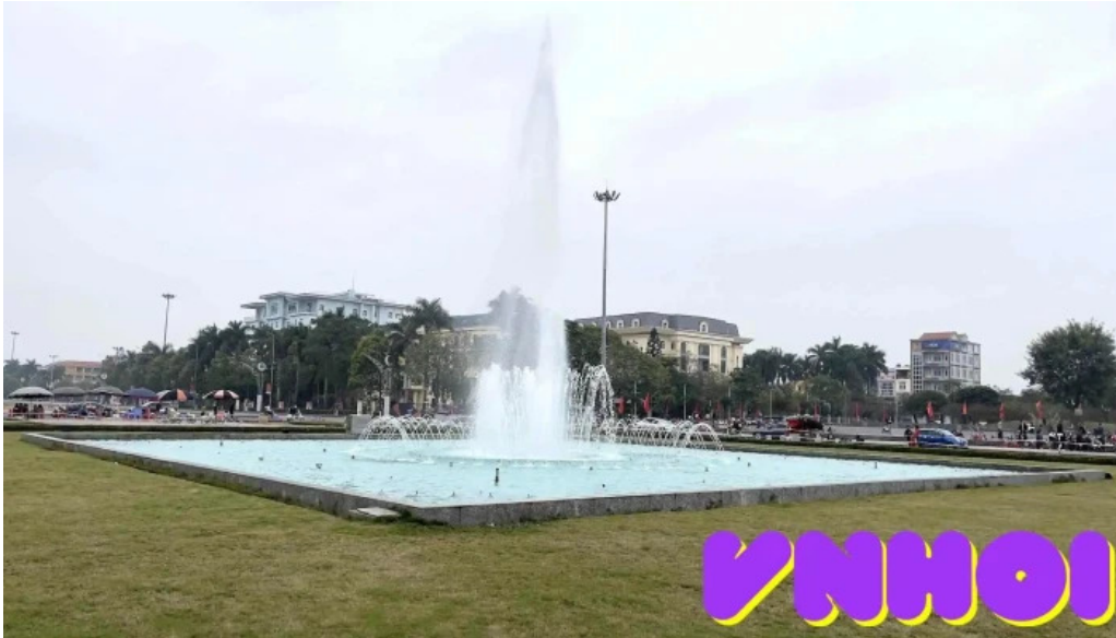
Dai phun nuoc quang truong hung yen tat ca