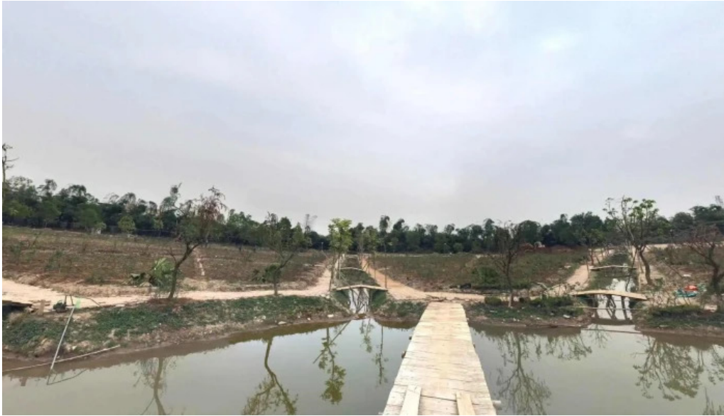
Cong vien hoa hong che do xem pho va 360deg