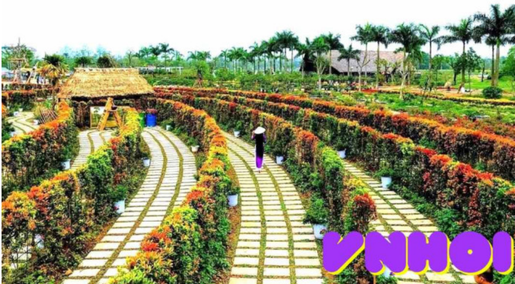
Cong vien hoa h?ng ha n?i