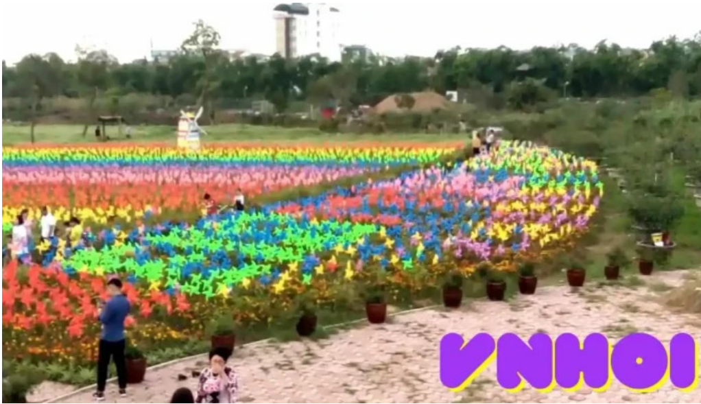
Cong vien hoa hong video