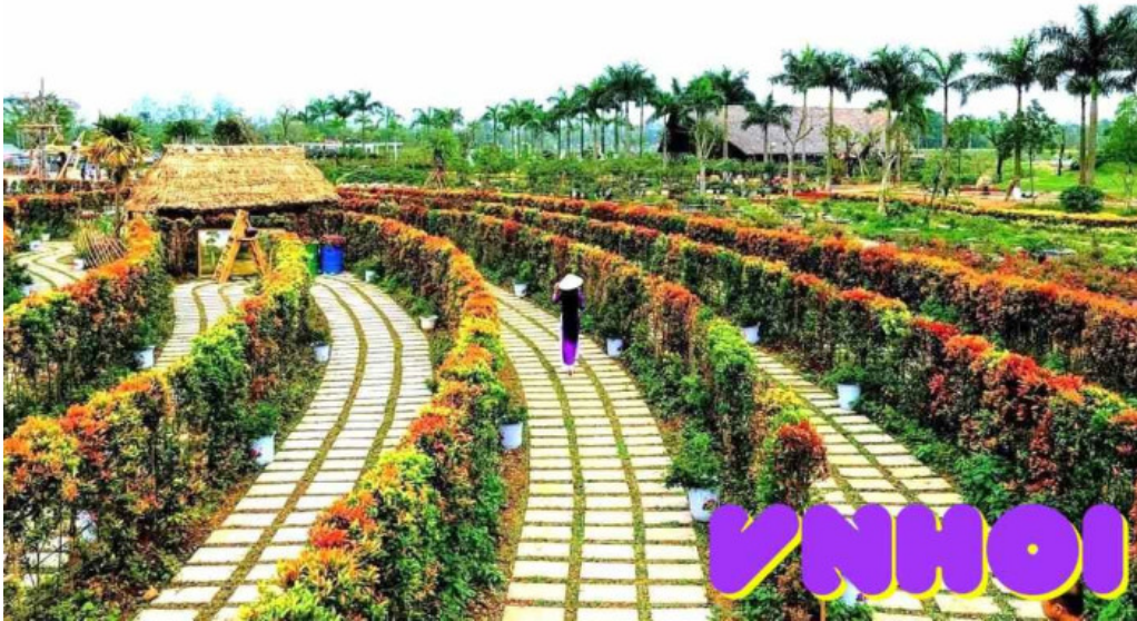
Cong vien hoa hong tat ca