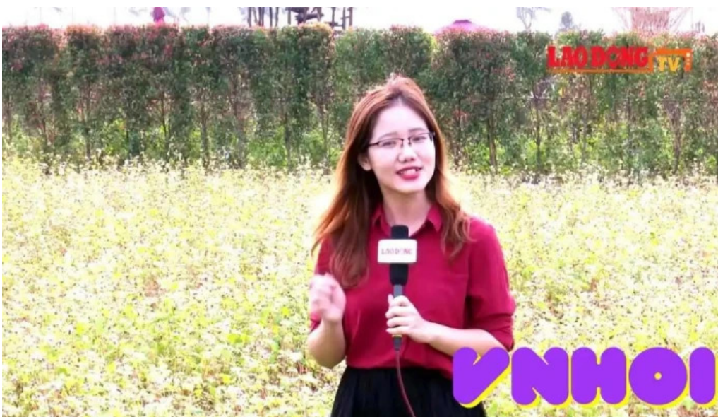
Cong vien hoa hong vuon