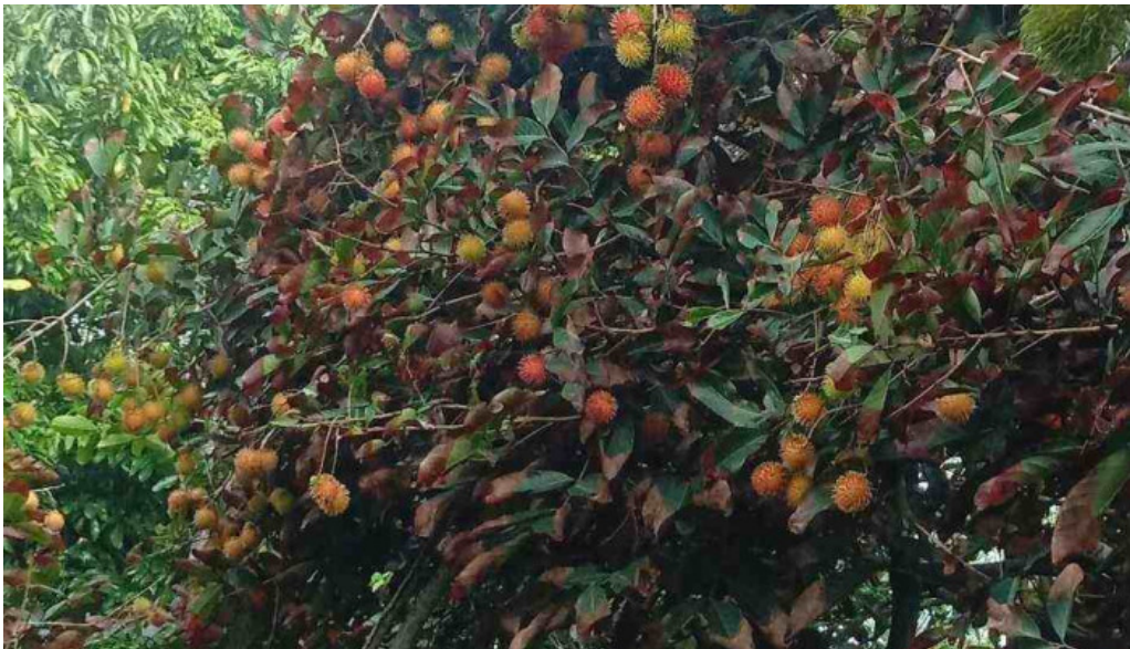
Vuon trai cay tam sang cua chu so huu