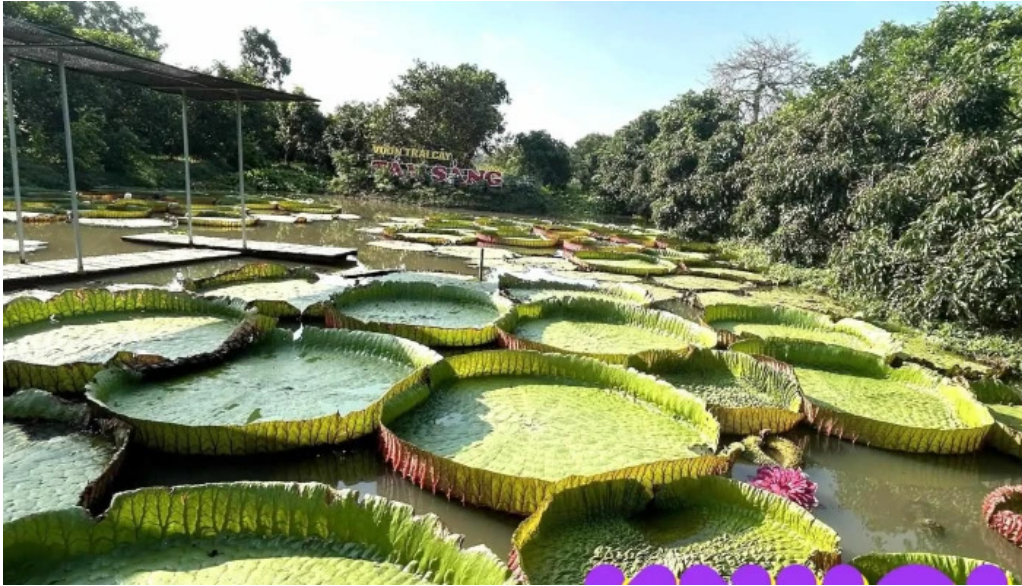
Vuon trai cay tam sang tat ca