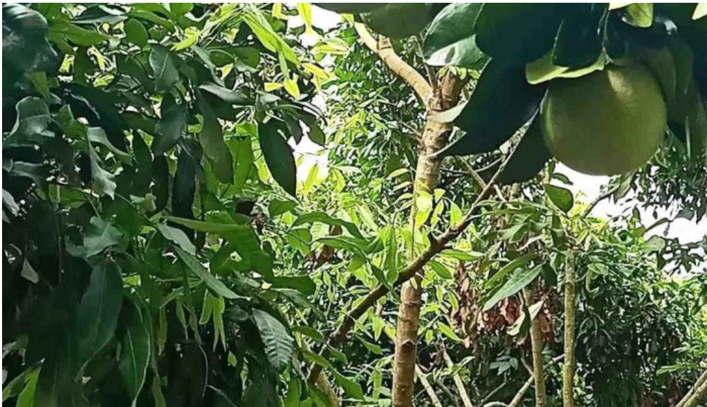
Vườn trái cây tam sang video