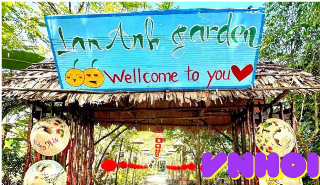
Vuon quyt hong lan anh tat ca