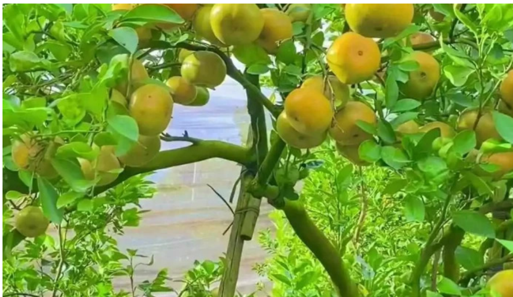
Vuon quyt hong lan anh cua chu so huu