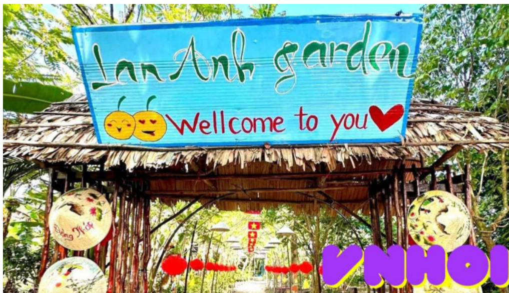
V??n quýt h?ng lan anh ??ng th?p