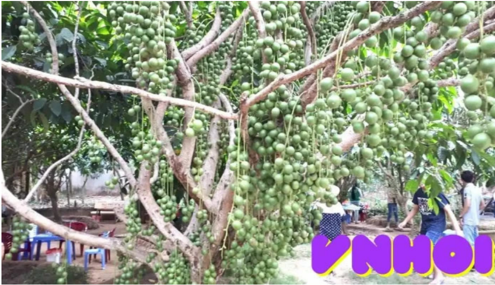
V??n dau tan thu?n ??ng thap