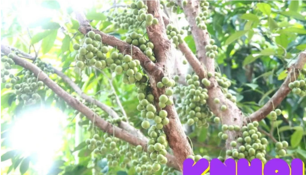
Vườn dâu tằm thuận của chủ sở hữu