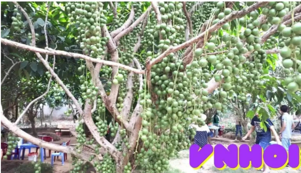
Vuon dau tan thuan tat ca