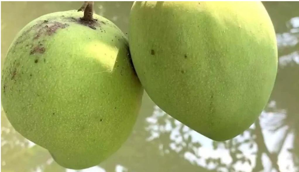
Vuon ma chin fruits garden cua chu so huu