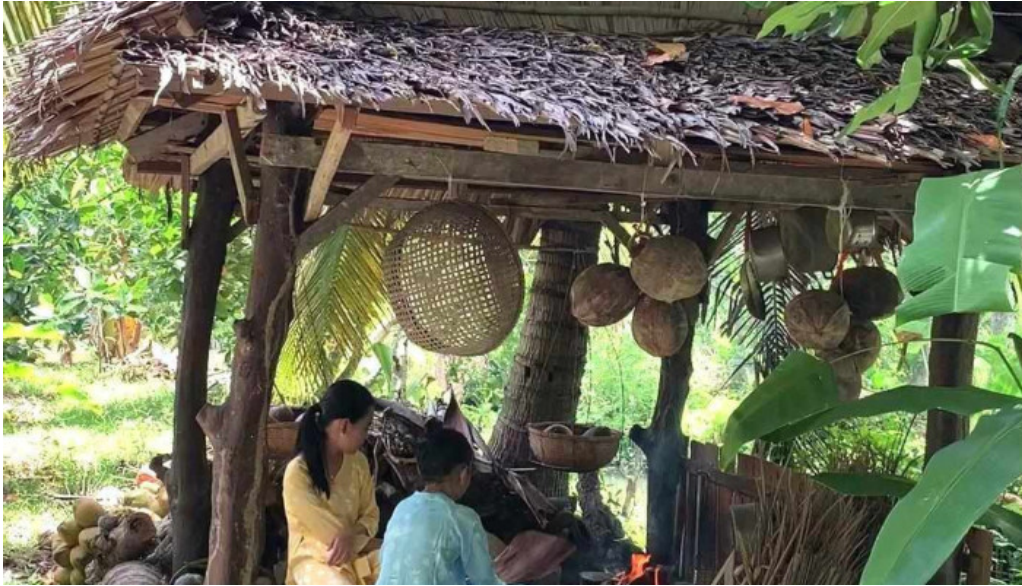
Vuon ma chin fruits garden video