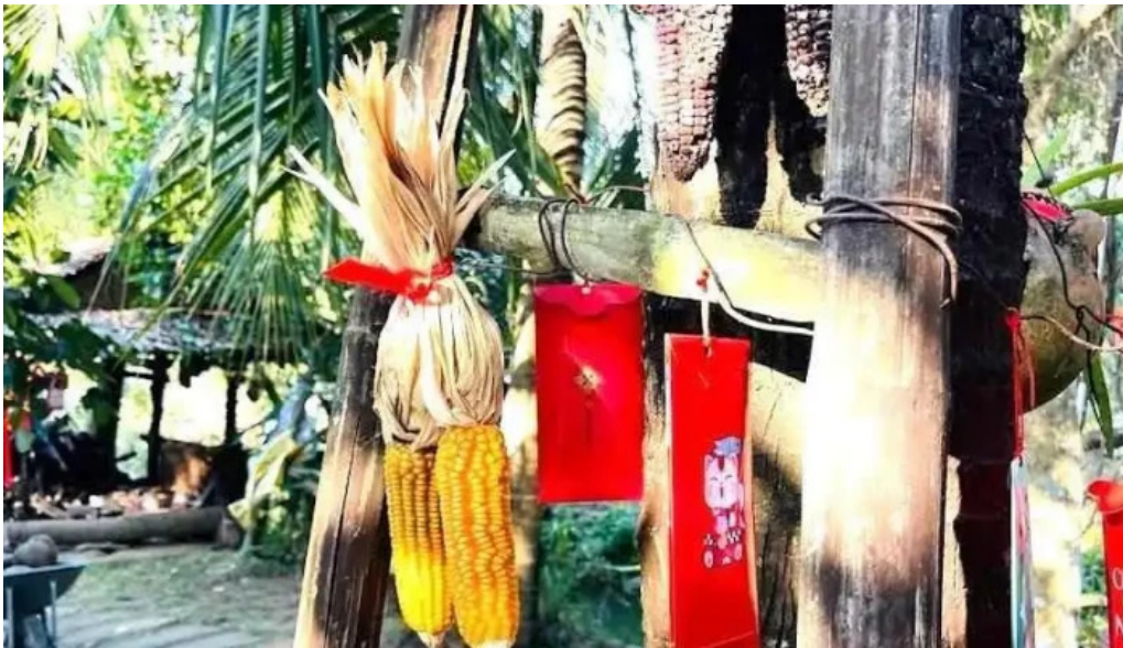
Vườn mả chín fruits garden tỉnh giang