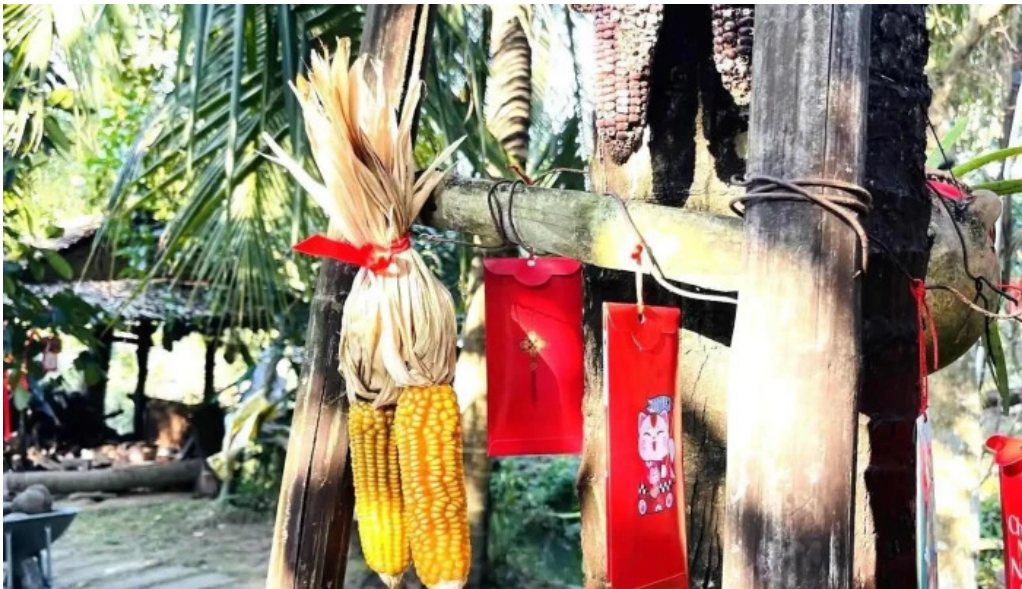
Vuon ma chin fruits garden tat ca