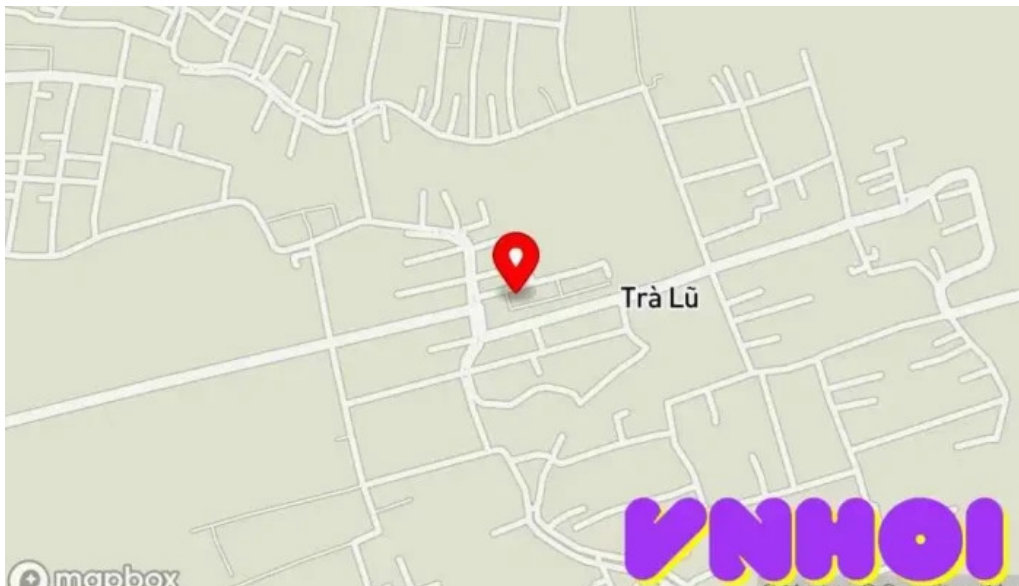
Vuong cung thanh duong phu nhai b?n ??