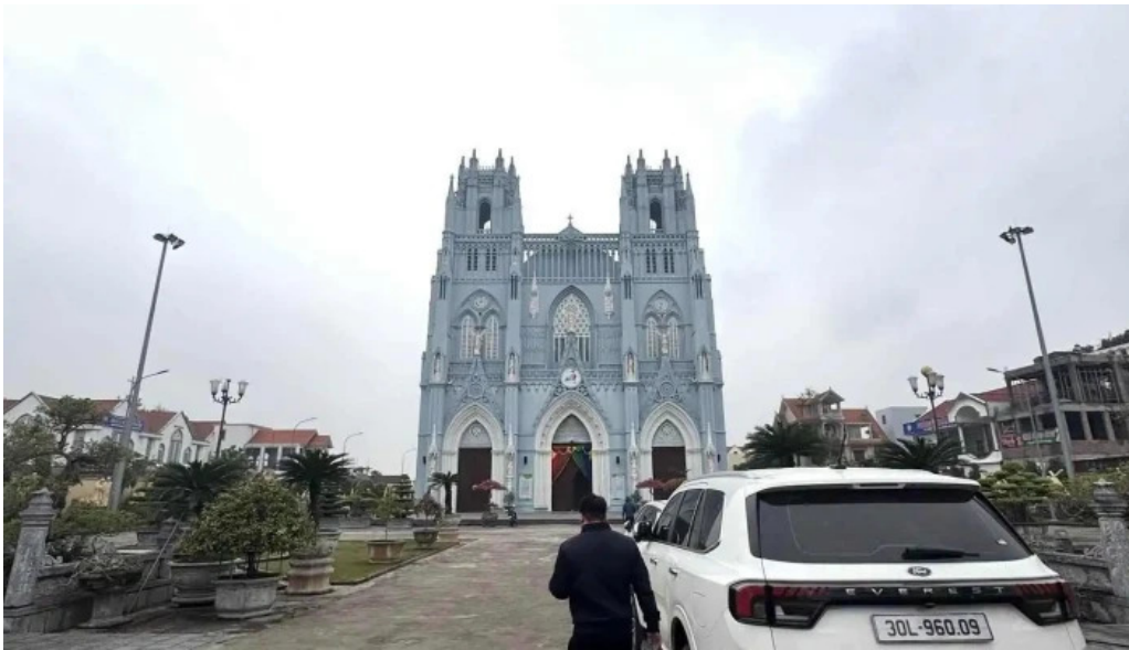
Vuong cung thanh duong phu nhai moi nhat