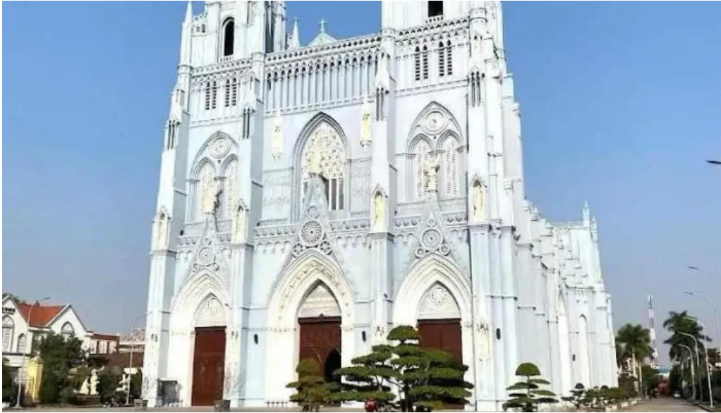
V??ng cung thanh ???ng phu nhai nam ??nh