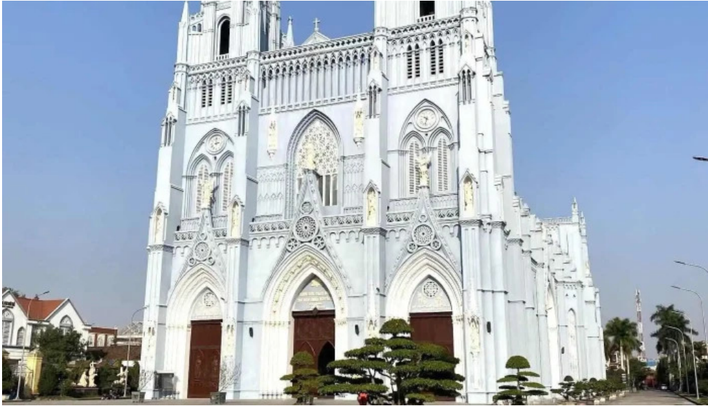
Vuong cung thanh duong phu nhai tat ca