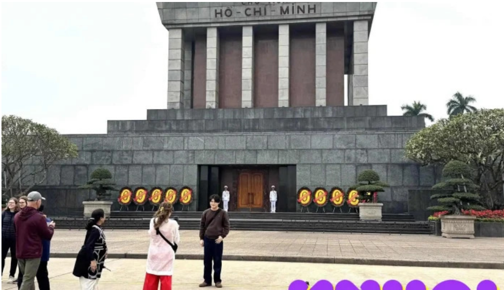
Phu chu tinh moi nhat