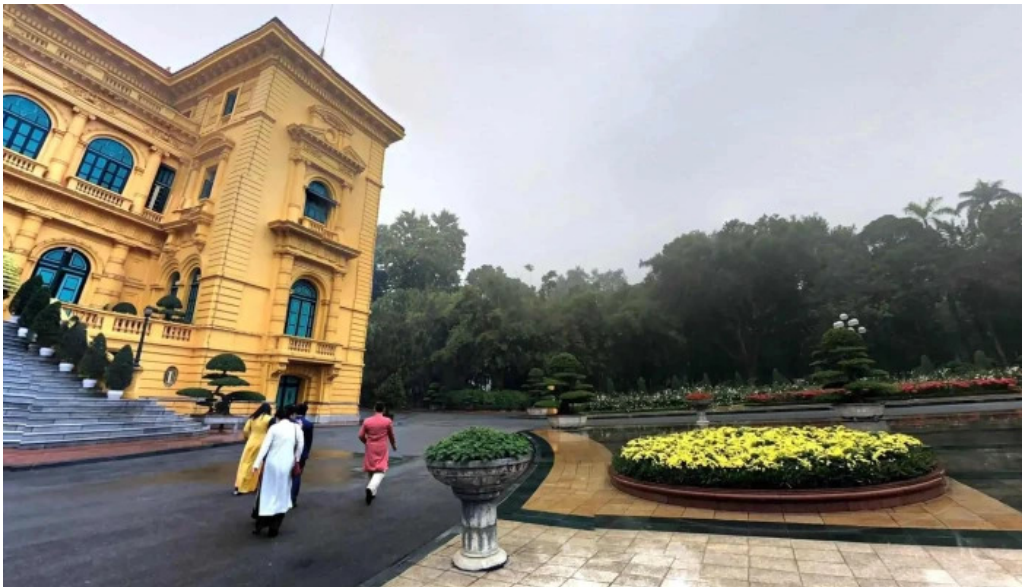
Phu chu tich che do xem pho va 360deg