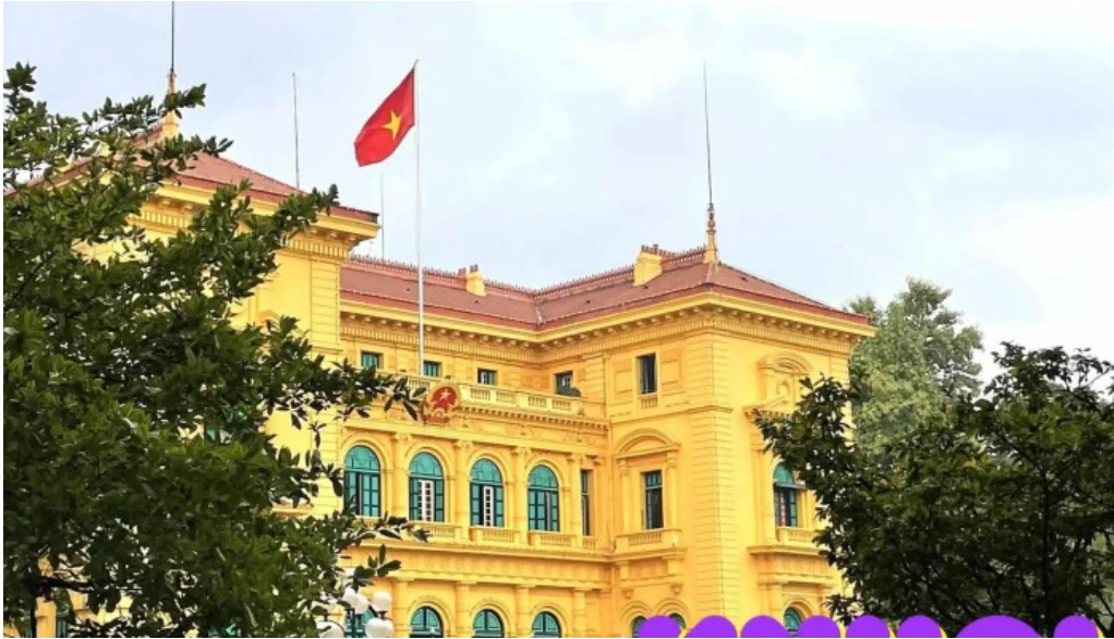
Phu chu tinh tat ca