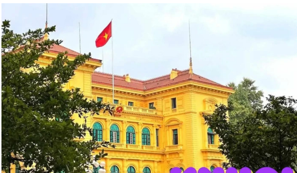
Ph? ch? t?ch ha n?i