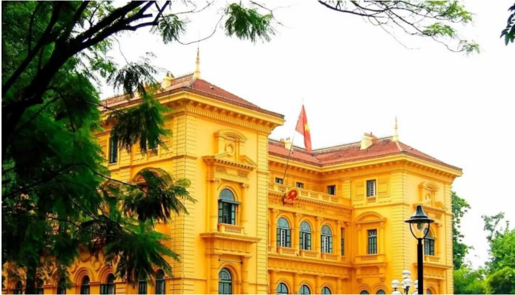
Phu chu tich cua chu so huu