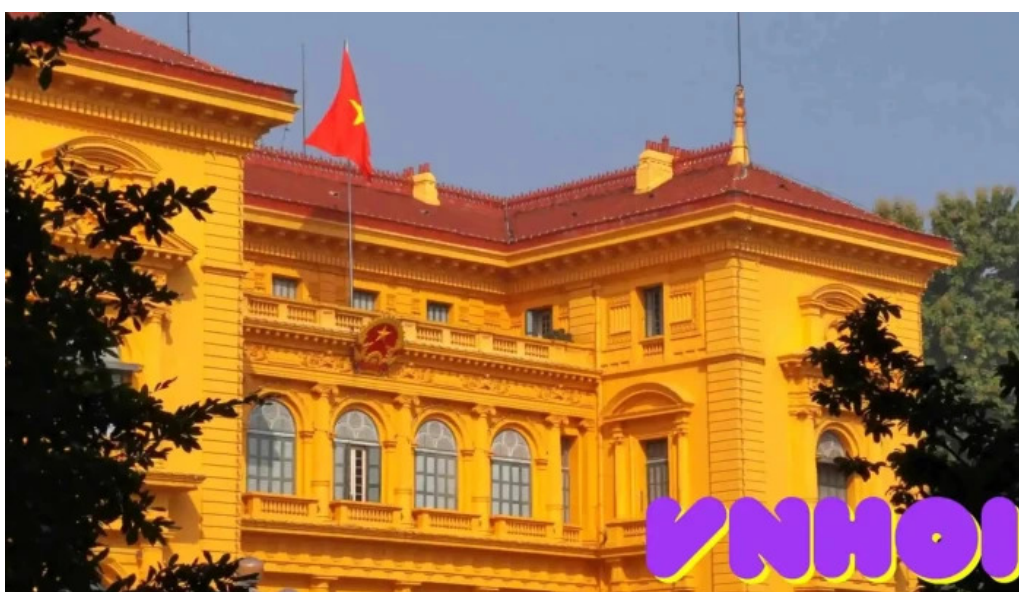
Phu chu tich video