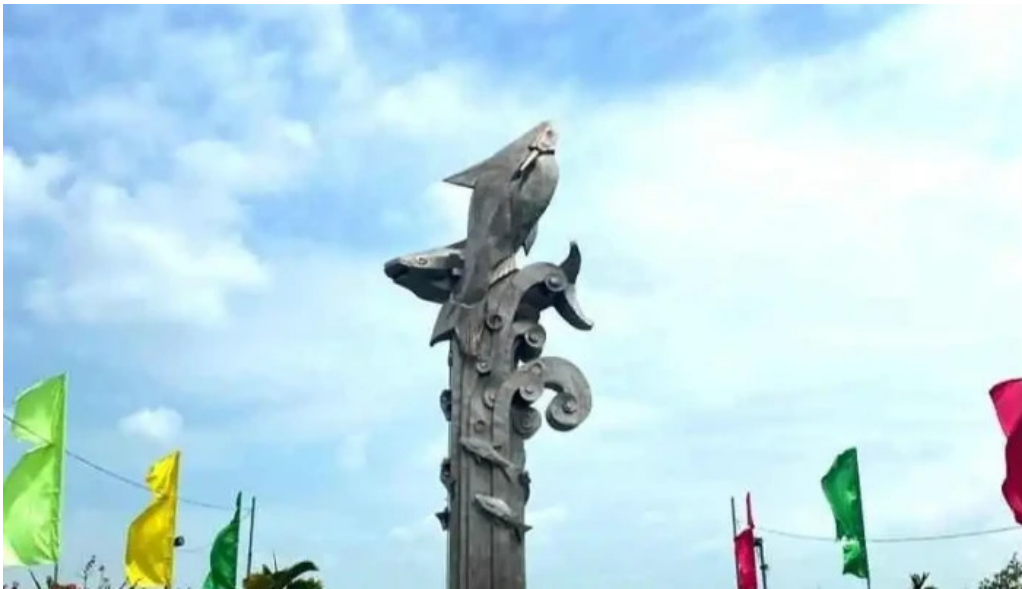
Tuong dai ca basa moi nhat