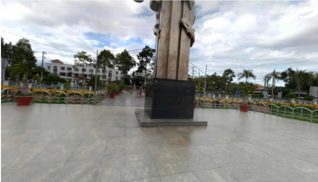
Tượng đài ca basa che do xem pho va 360deg