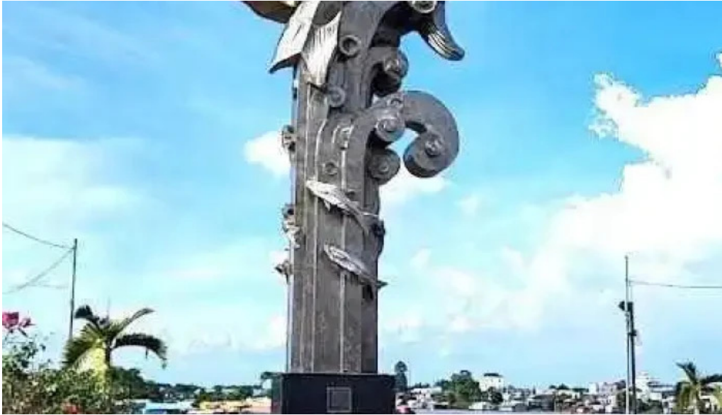
Tượng cá basa an giang