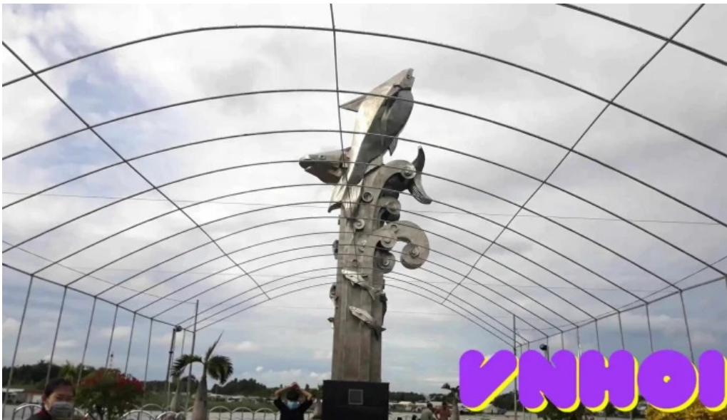
Tượng đại cá basa video