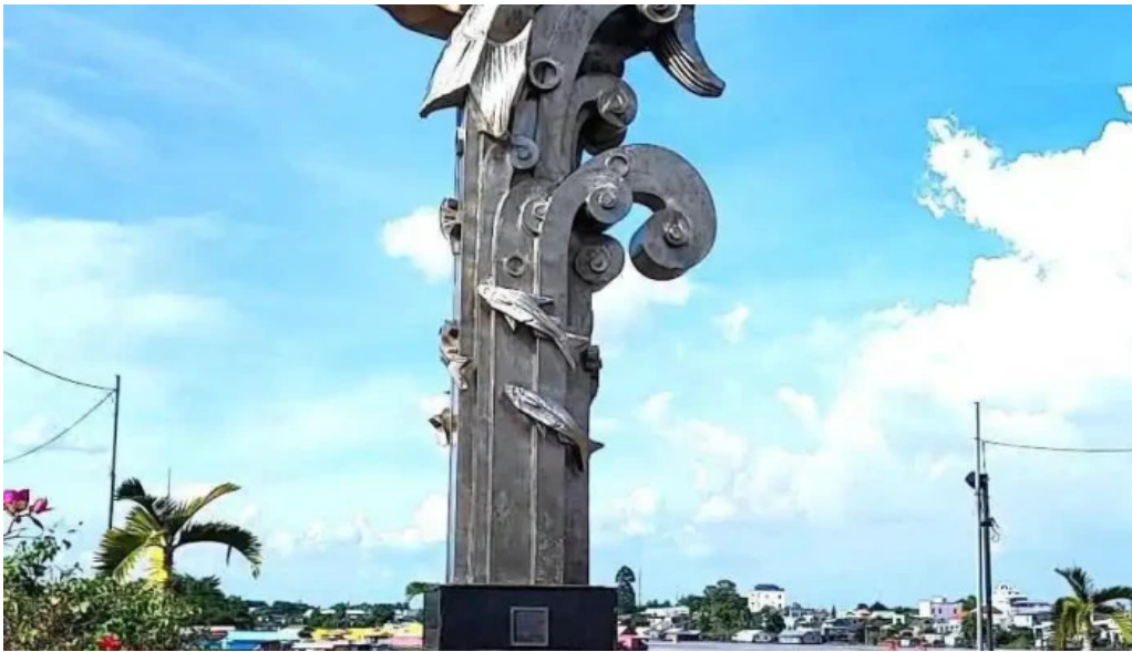
Tuong dai ca basa tat ca