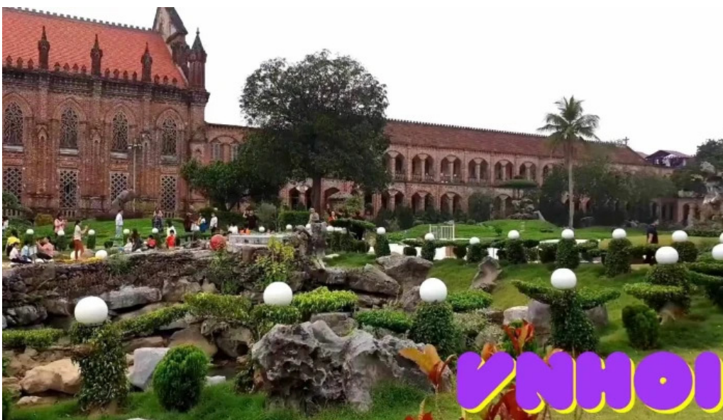
Dan vien thanh mau chau son video