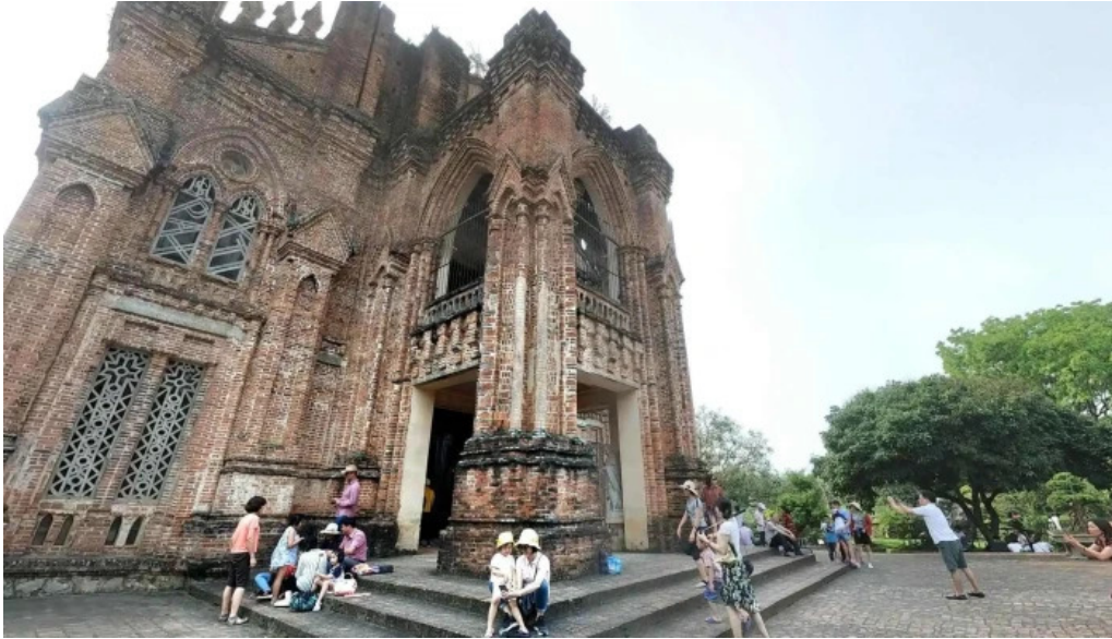
Dan vien thanh mau chau son che do xem pho va 360deg