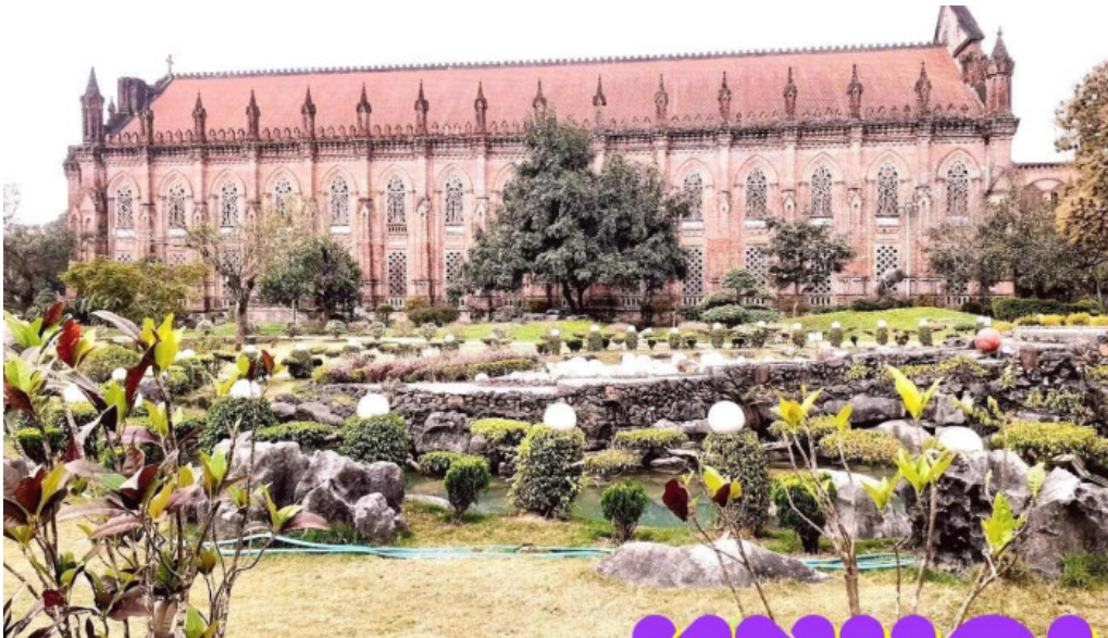
?an vi?n thanh m?u chau s?n ninh bình