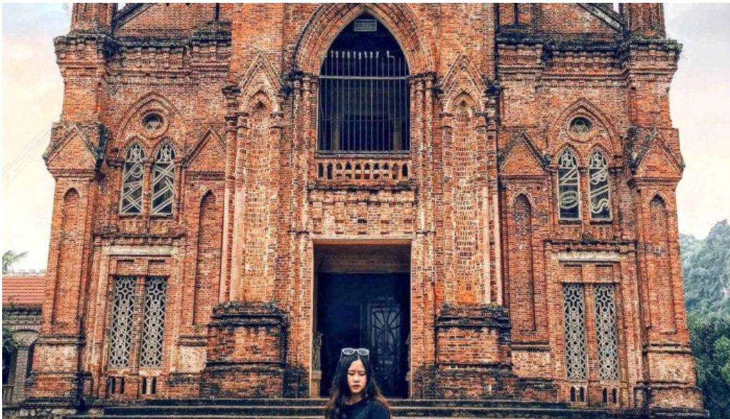
Dan vien thanh mau chau son moi nhat