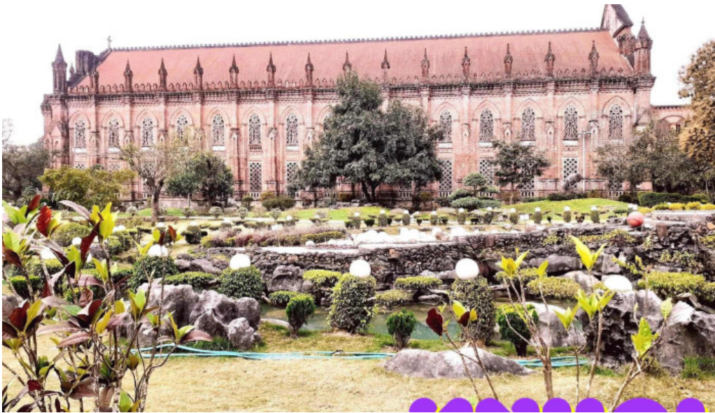
Dan vien thanh mau chau son tat ca