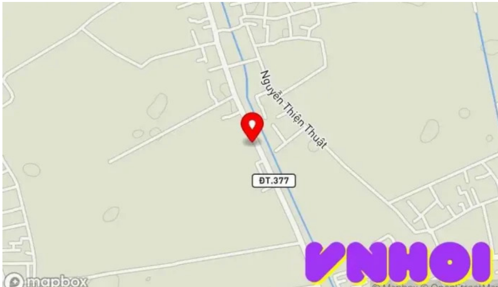
Khu vui ch?i h?ng yên