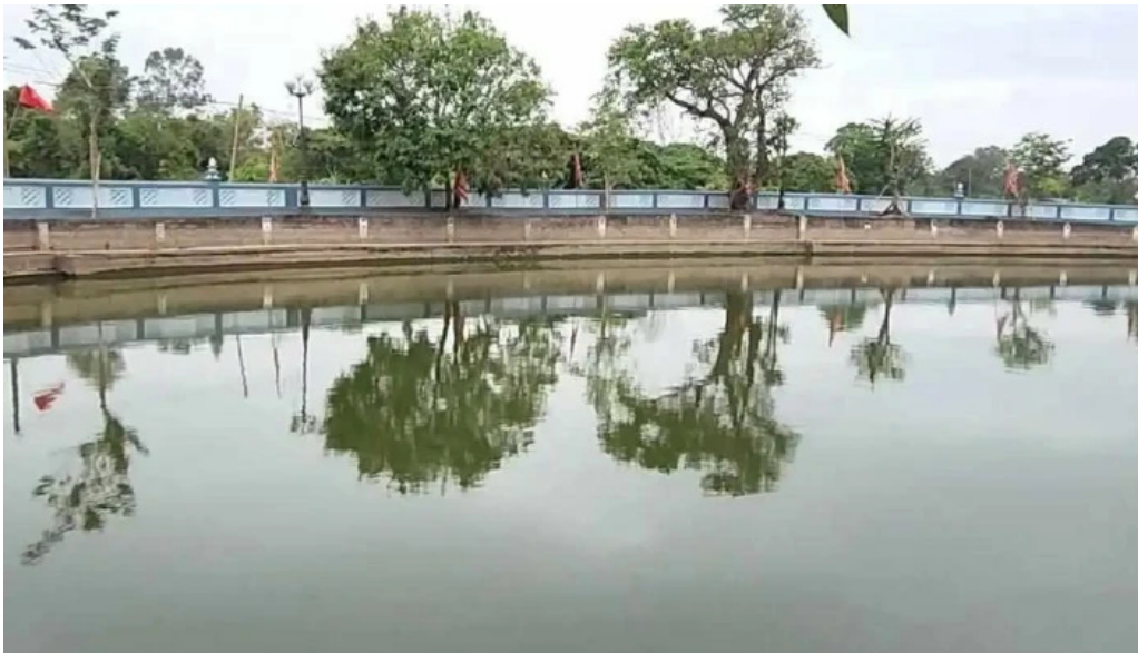
Den tra phuong dau che video