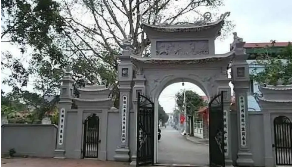
??n tra ph??ng ??u che h?ng yen