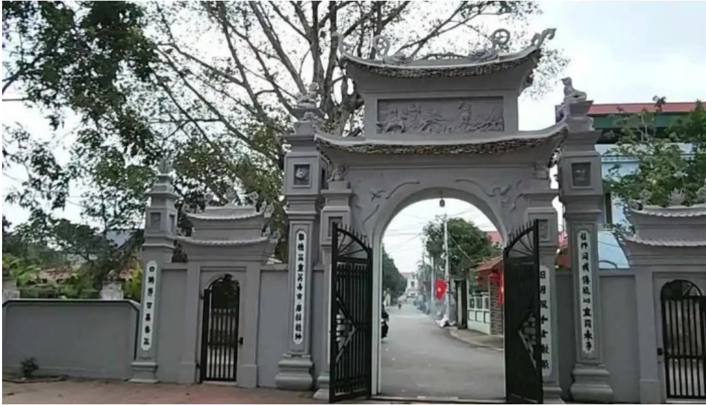
Den tra phuong dau che tat ca