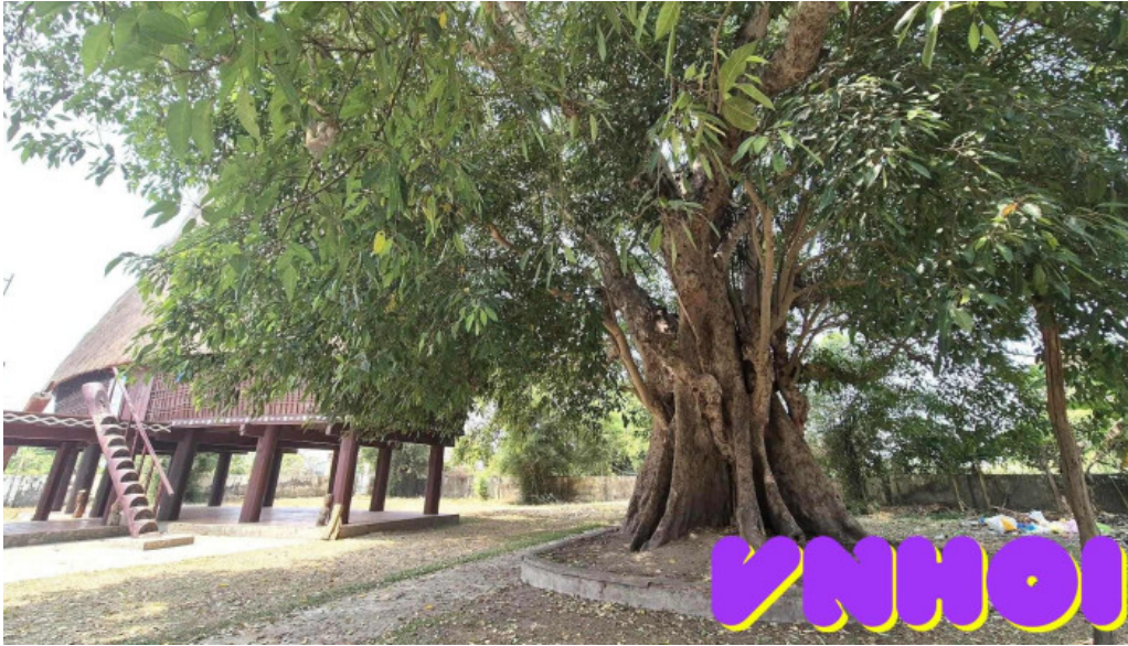
Nha rong konklor kon tum moi nhat