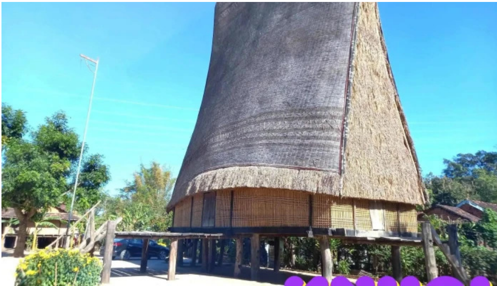
Nha rong konklor kon tum tat ca