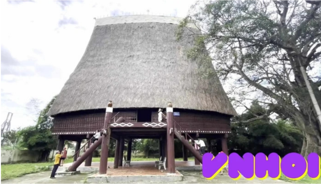
Nha rong konklor kon tum video