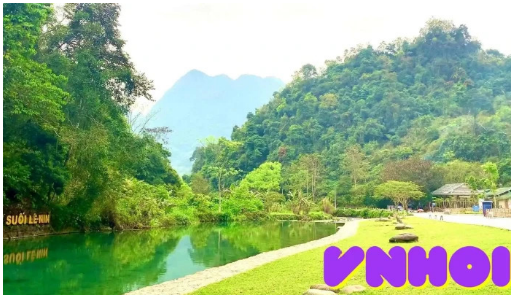
Núi các mac video