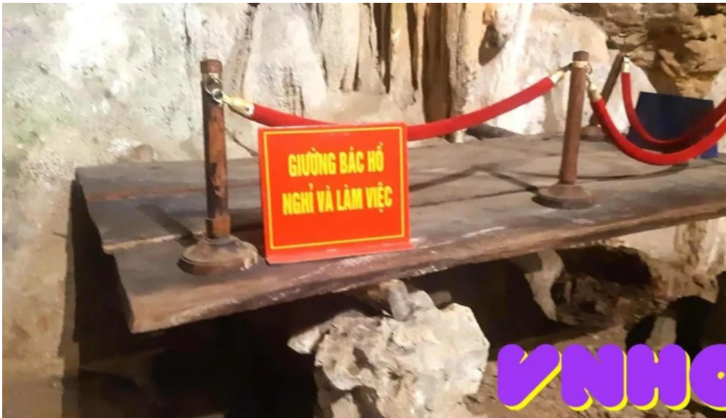
Núi các mac moi nhat