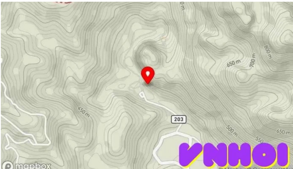
Núi cạc mạc b?n ??