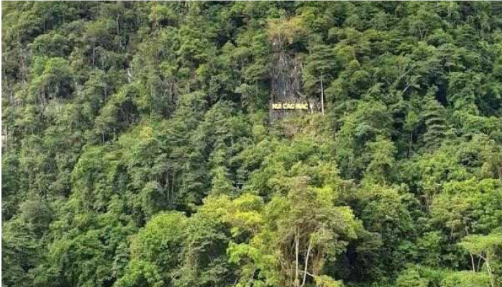
Núi cạc mạc cao b?ng