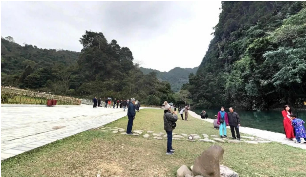
Núi các mac che do xem pho va 360deg