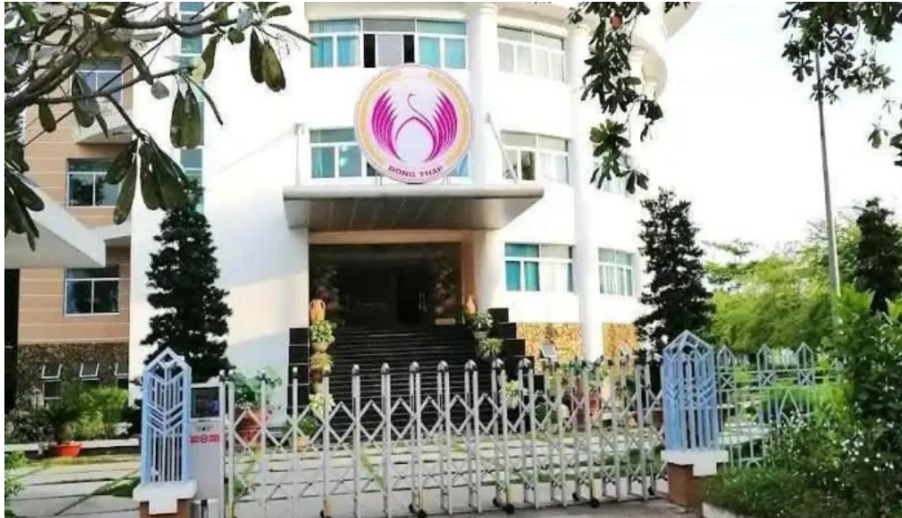
S? v?n hoa th? thao va du l?ch t?nh ??ng thap ??ng thap