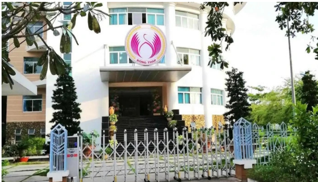
So van hoa the thao va du lich tinh dong thap tat ca