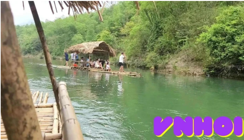
Suoi cham video