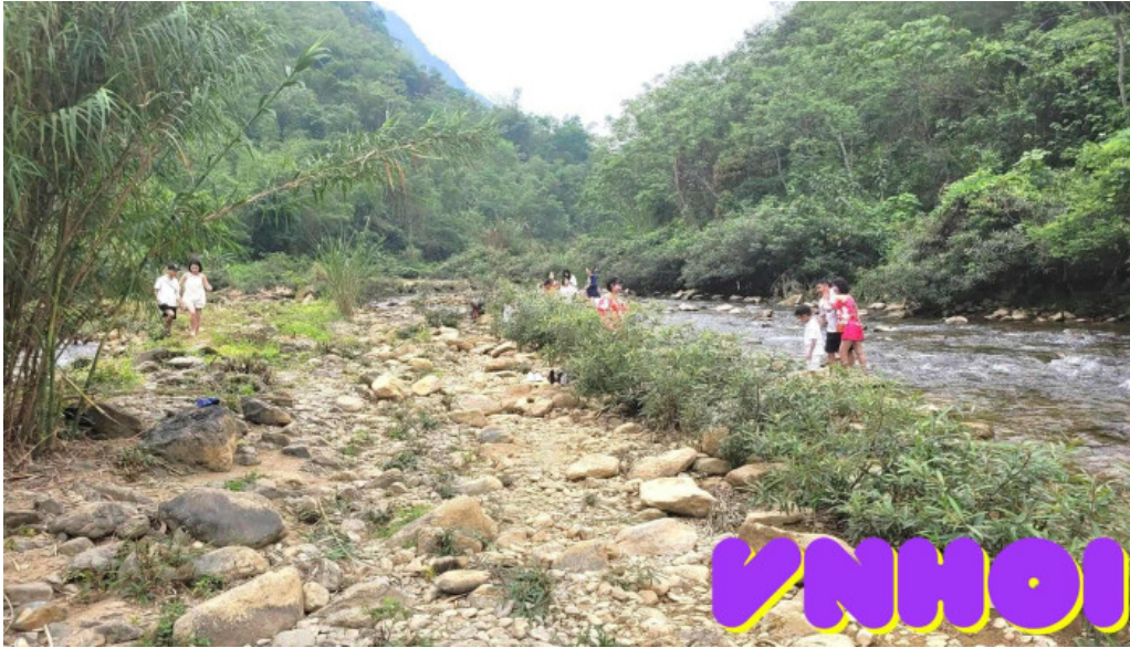
Suoi cham tat ca