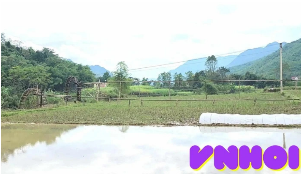
Suoi cham nui