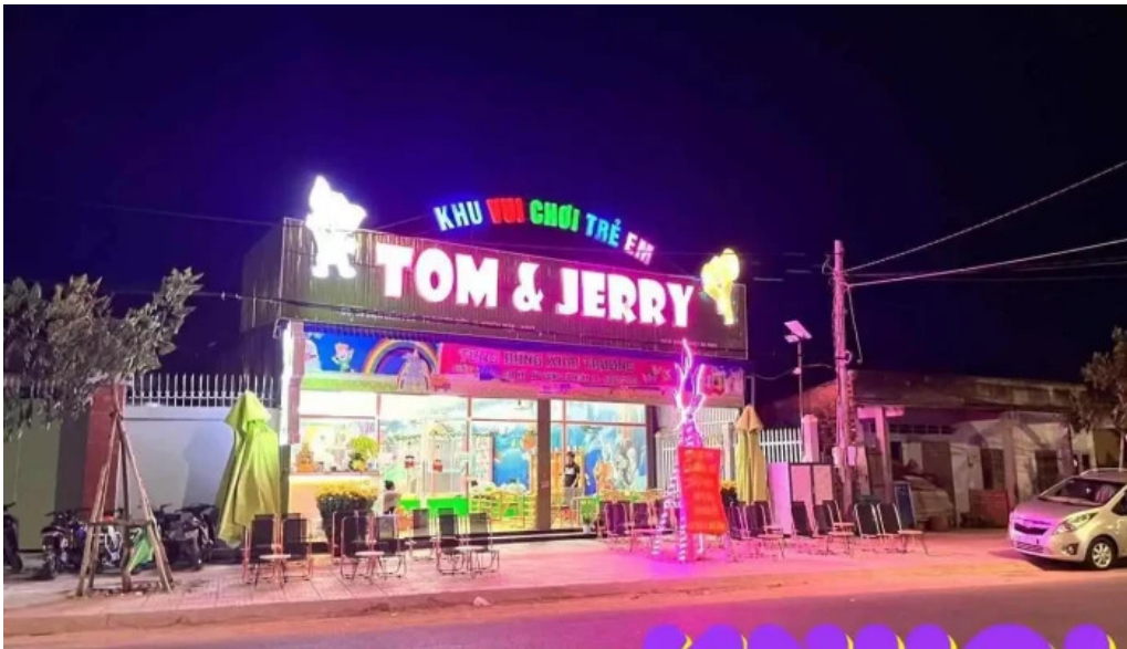
Khu vui chơi trẻ em tom va jerry xuyên mốc tát ca