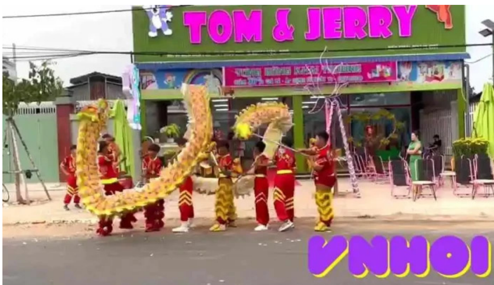
Khu vui ch?i tre em tom va jerry xuyen moc video