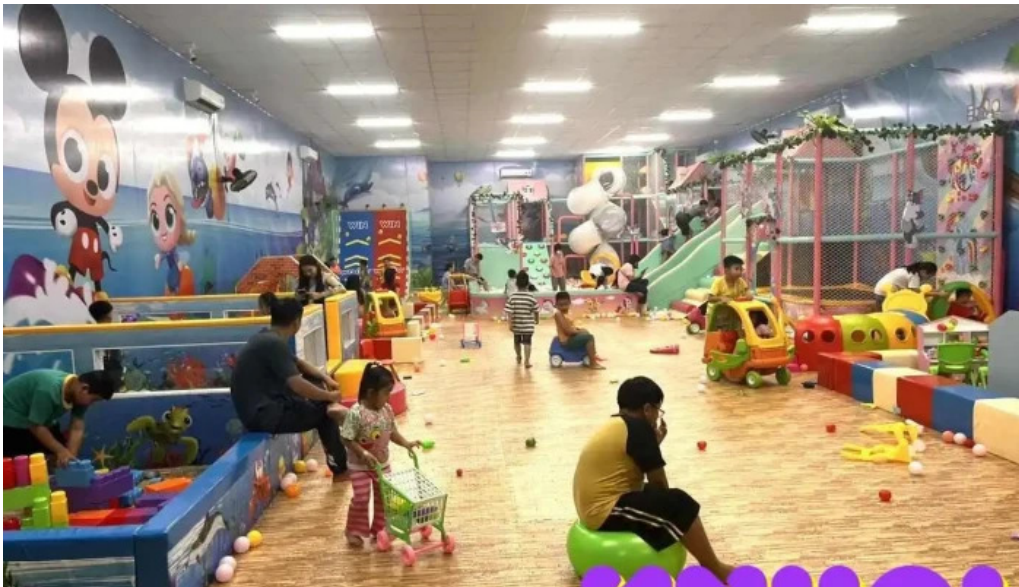
Khu vui chơi trẻ em tom va jerry xuyên mốc sân chơi