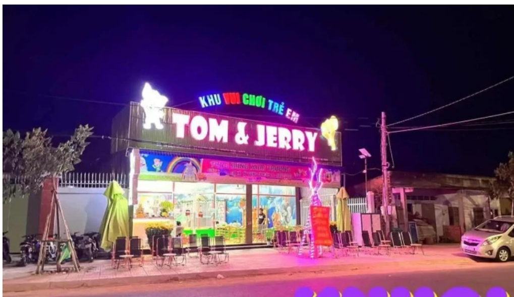
Khu vui ch?i tr? em tom va jerry xuyen m?c ba r?a v?ng tau