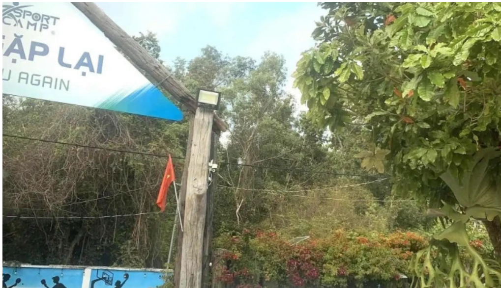
Khu bao tồn thiên nhiên mới nhất