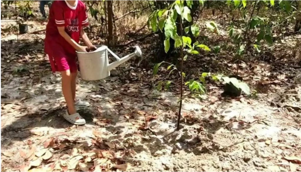
Khu bao ton thien nhien video