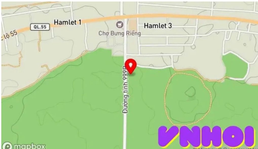
Khu bảo tồn thiên nhiên b?n ??