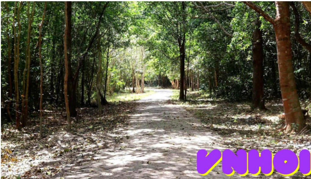
Khu b?o t?n thiên nhiên ba r?a v?ng tau