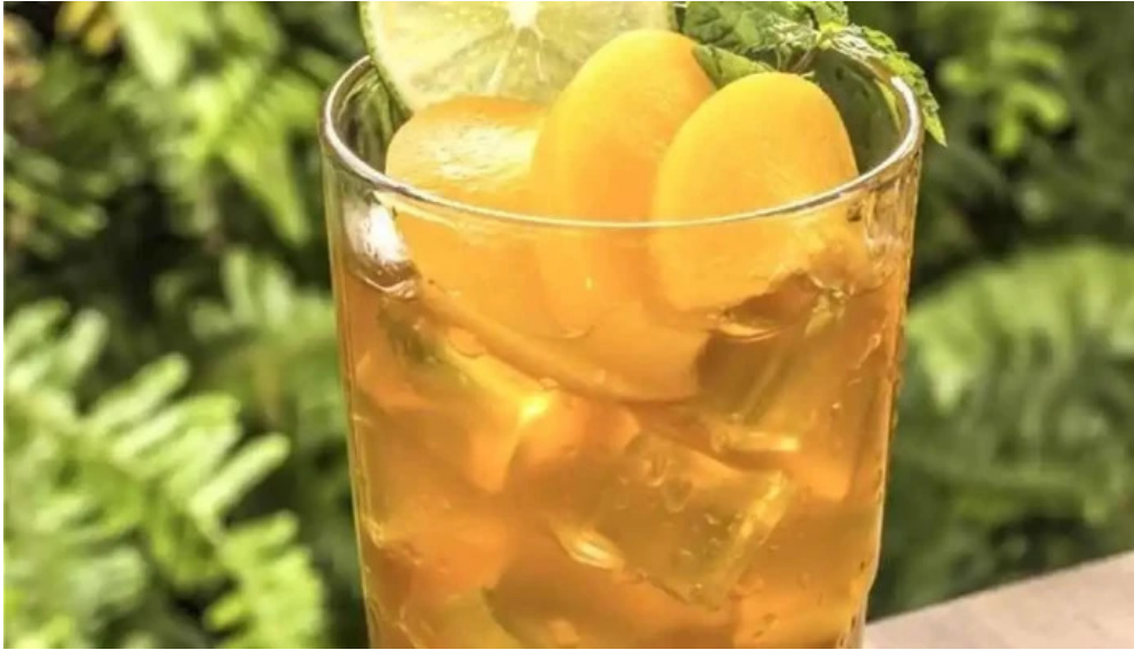
Cafe dang cua chu so huu