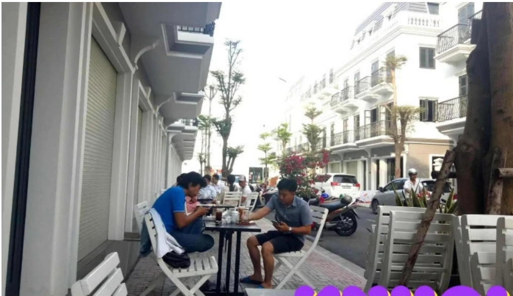
Cafe dang bau khong khi