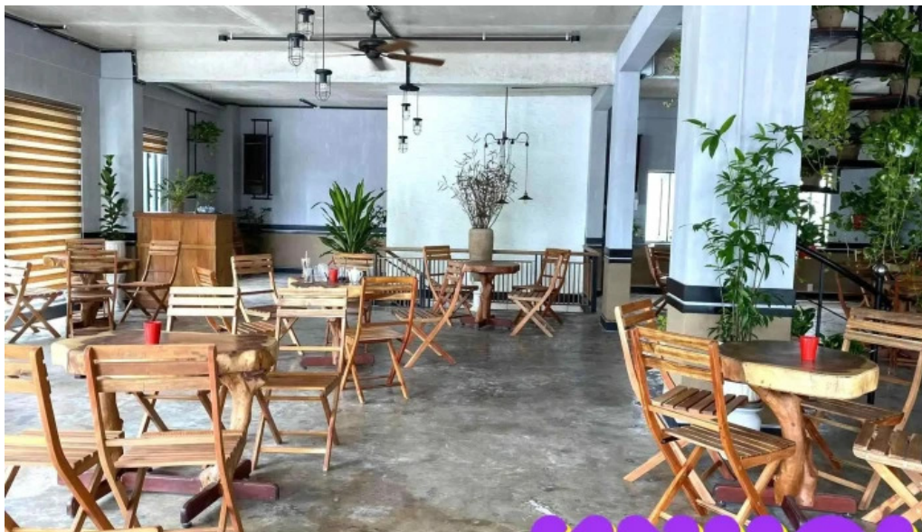
Cafe đang tat ca