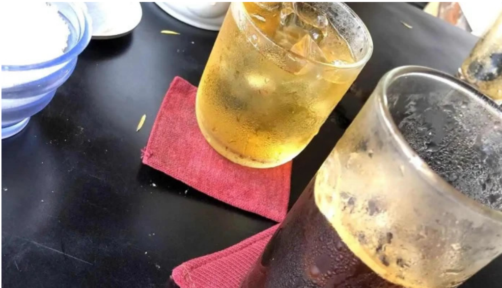
Cafe dang ca phe pha lanh