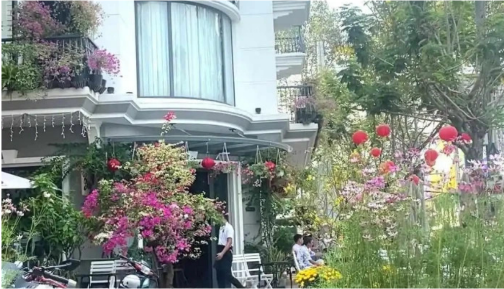
Cafe dang video