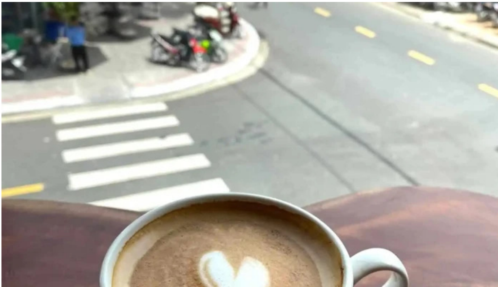
Cafe dang thuc pham va do uong