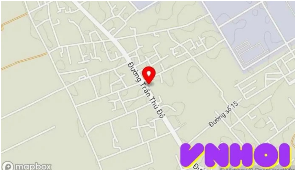
Kozy land coffee b?n ??