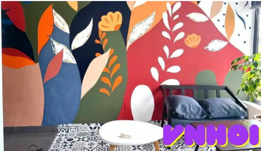
Kozy land coffee qu?ng nam