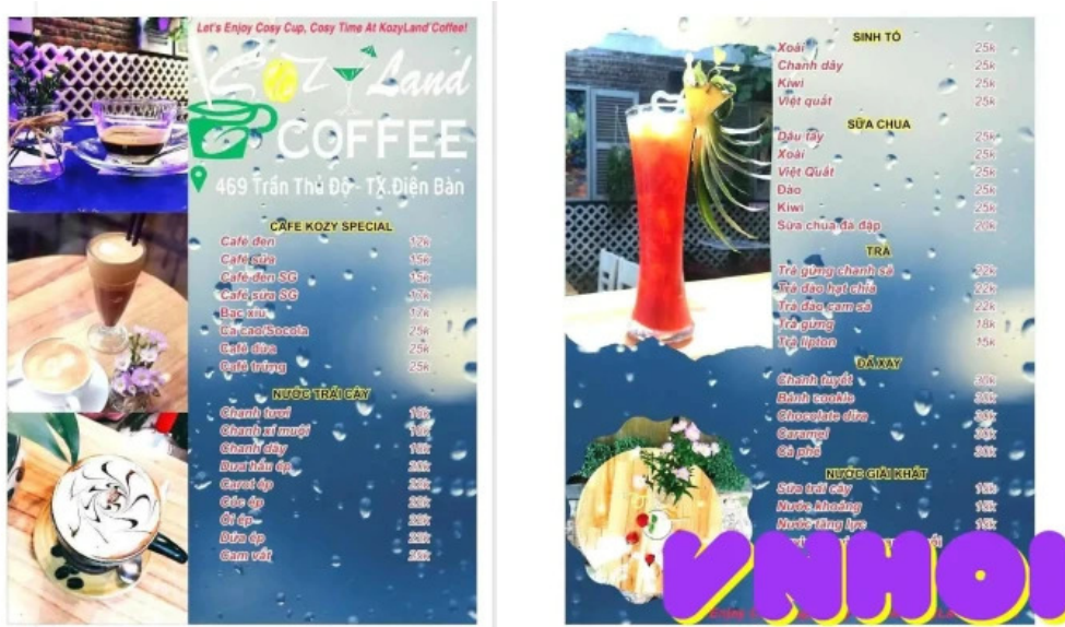
Kozy land coffee thực đơn