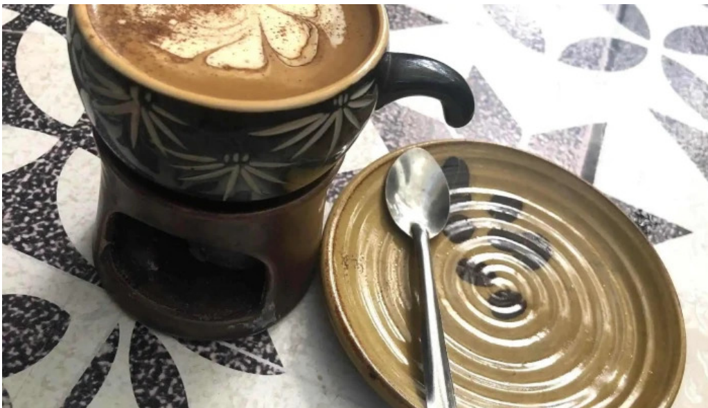
Kozy land coffee cappuccino