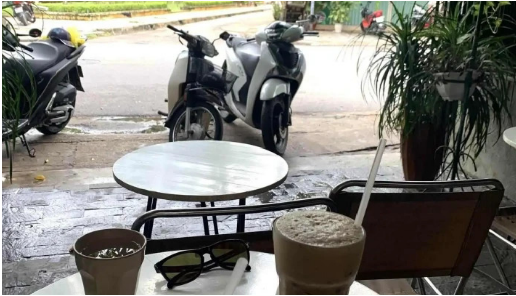
Kozy land coffee ca phe