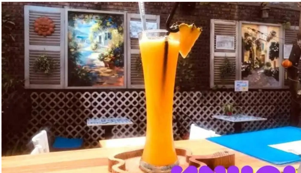
Kozy land coffee nuoc ep