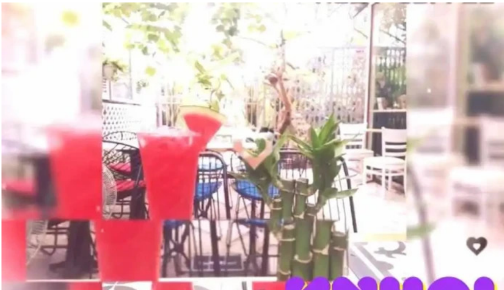
Kozy land coffee video