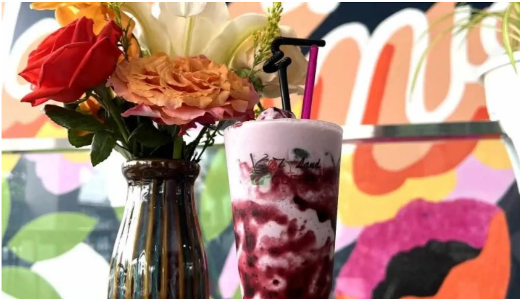
Kozy land coffee chua chu so huu