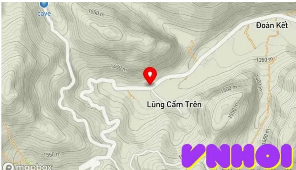
Chuyen vung cao b?n ??