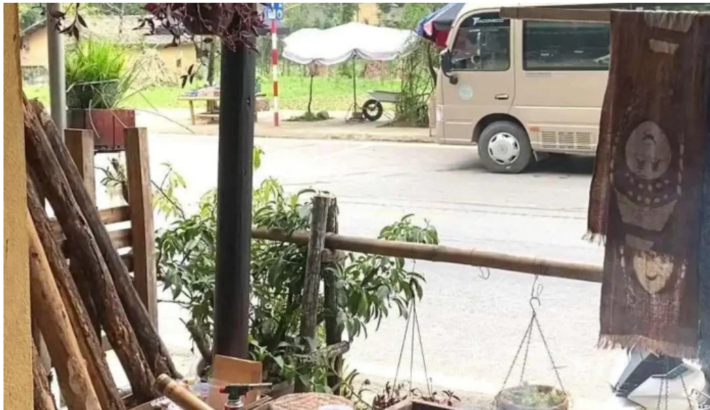
Chuyen vung cao tat ca