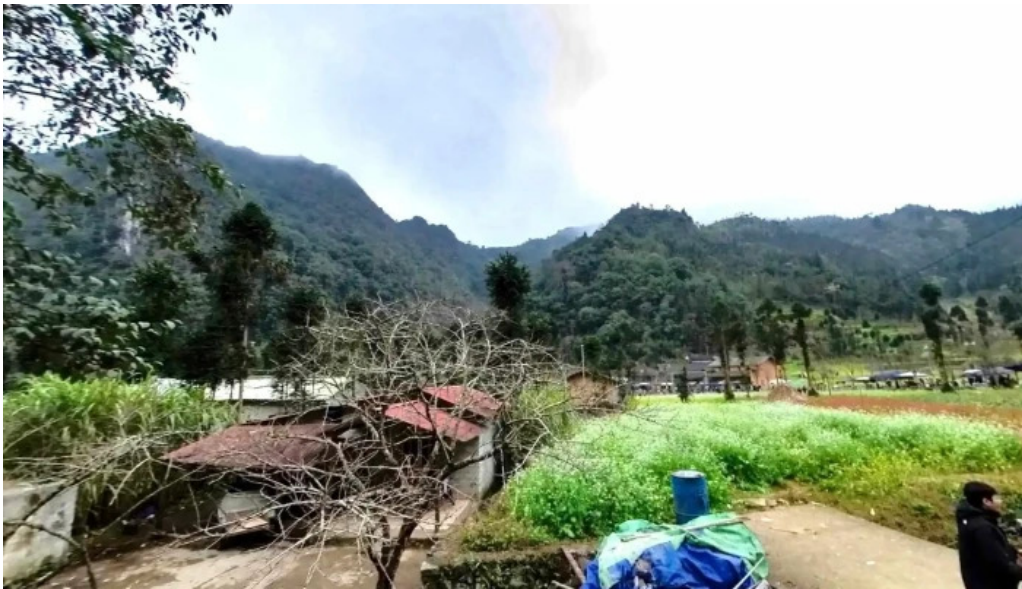
Chuyen vung cao che do xem pho va 360deg