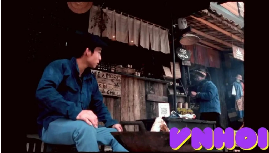
Chuyen vung cao video