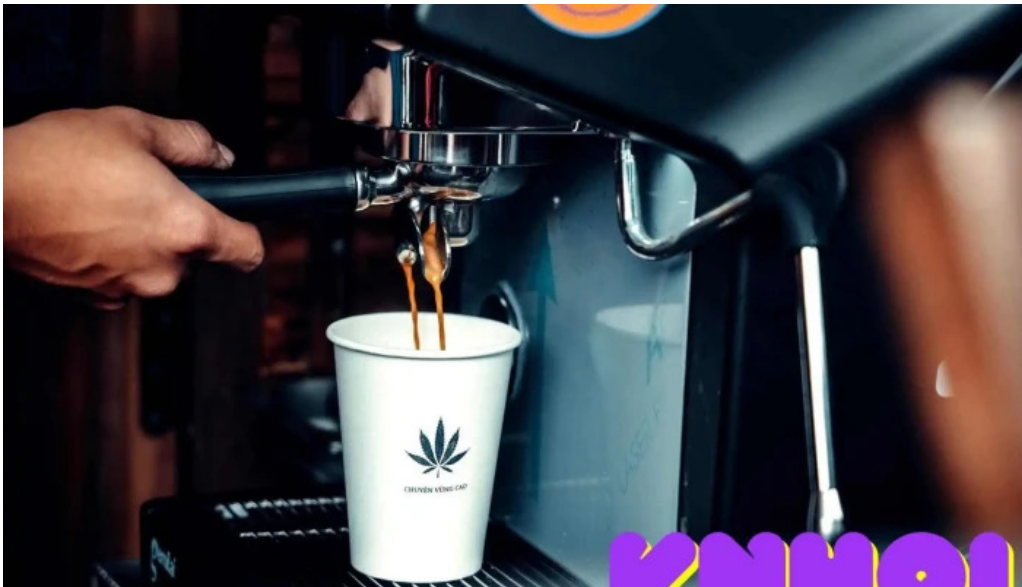
Chuyen vung cao thuc pham va do uong