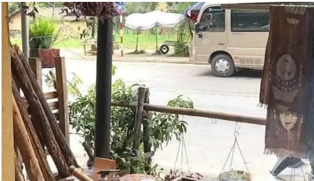
Chuy?n vùng cao ha giang