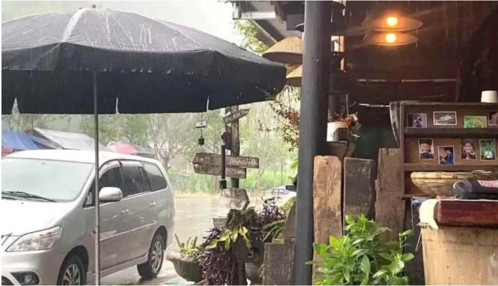
Chuyen vung cao cua chu so huu