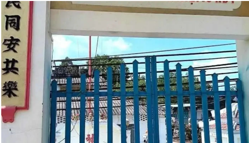
Đình tan l? ??ng thap