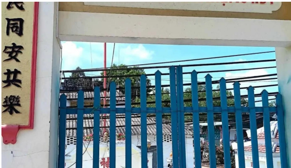
Dinh tan le tat ca