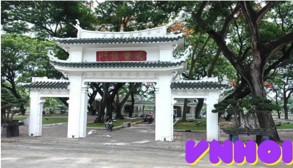
V?n thanh mi?u ??ng th?p