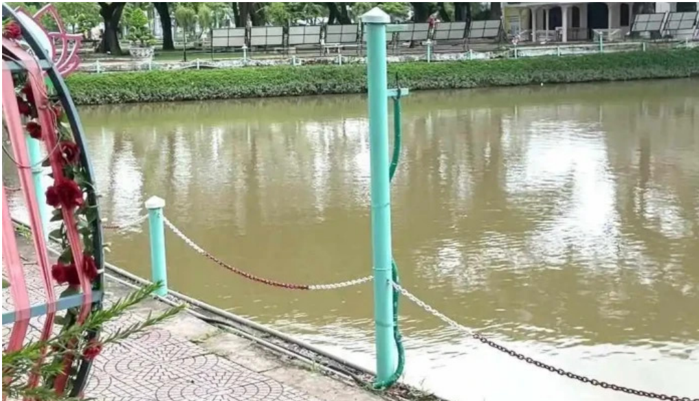
Van thanh mieu video