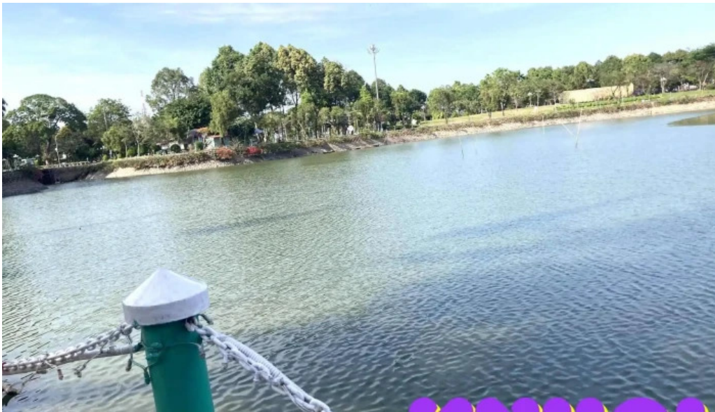
Van thanh mieu moi nhat