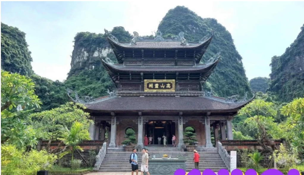
Den trang an co tat ca