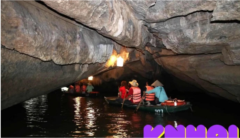
Den trang an co moi nhat