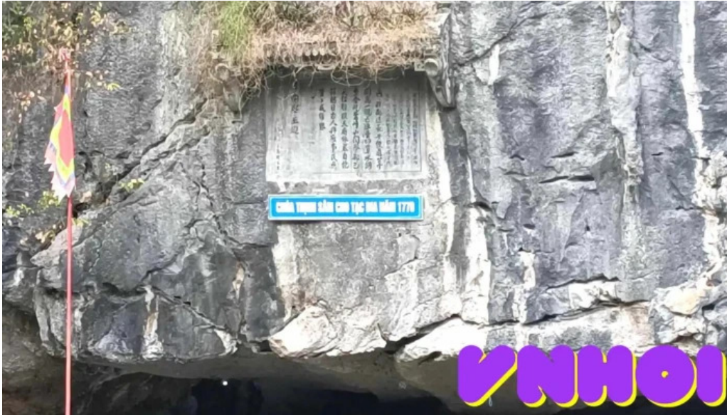
Den trang an co video