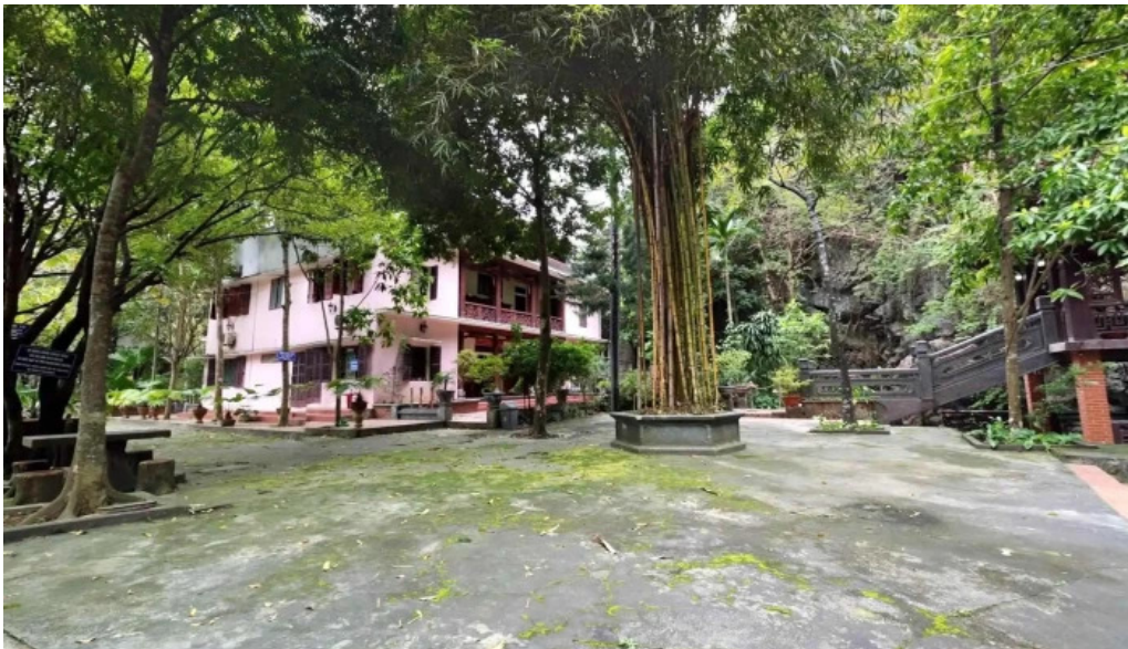
Den trang an co che do xem pho va 360deg