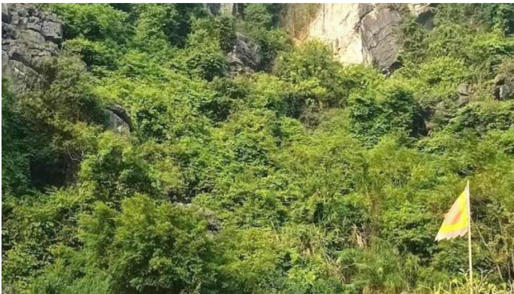
??n trang an c? ninh bình