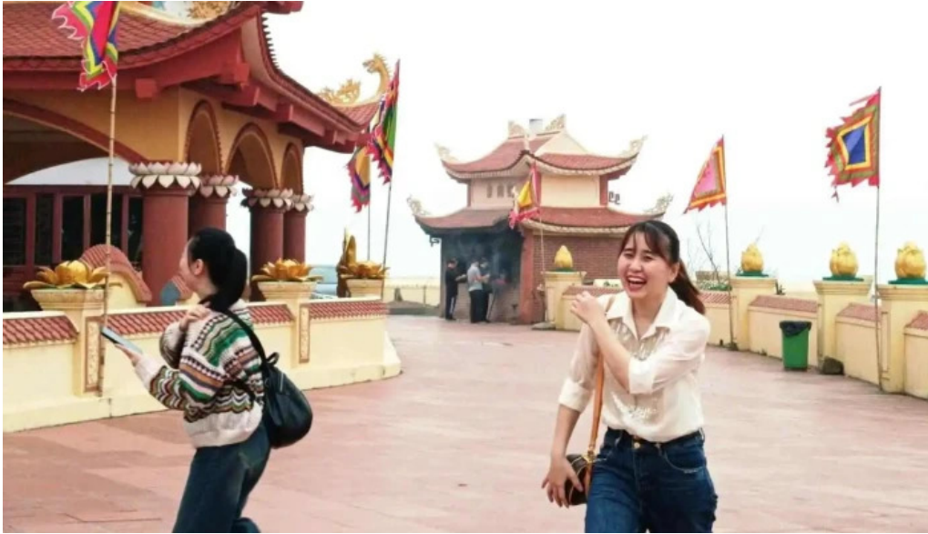
Den ba de moi nhat