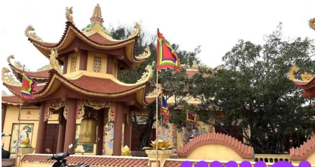
Trung tâm Hội Phòng