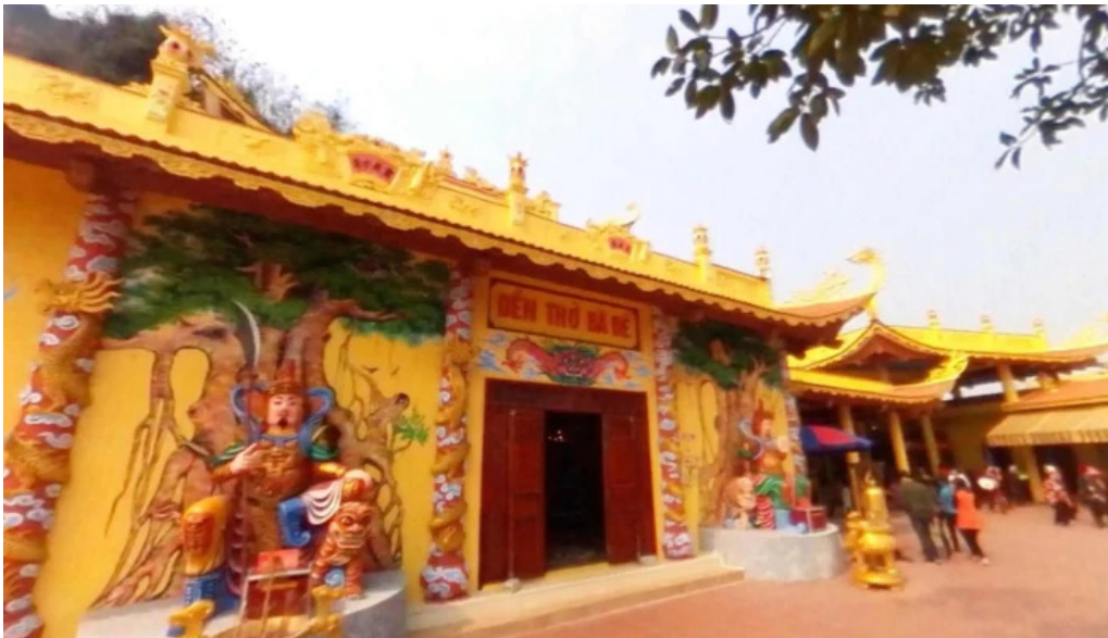
Den ba de che do xem pho va 360deg