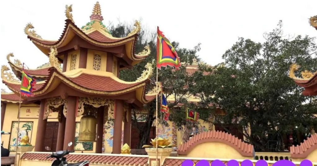
Den ba de tat ca