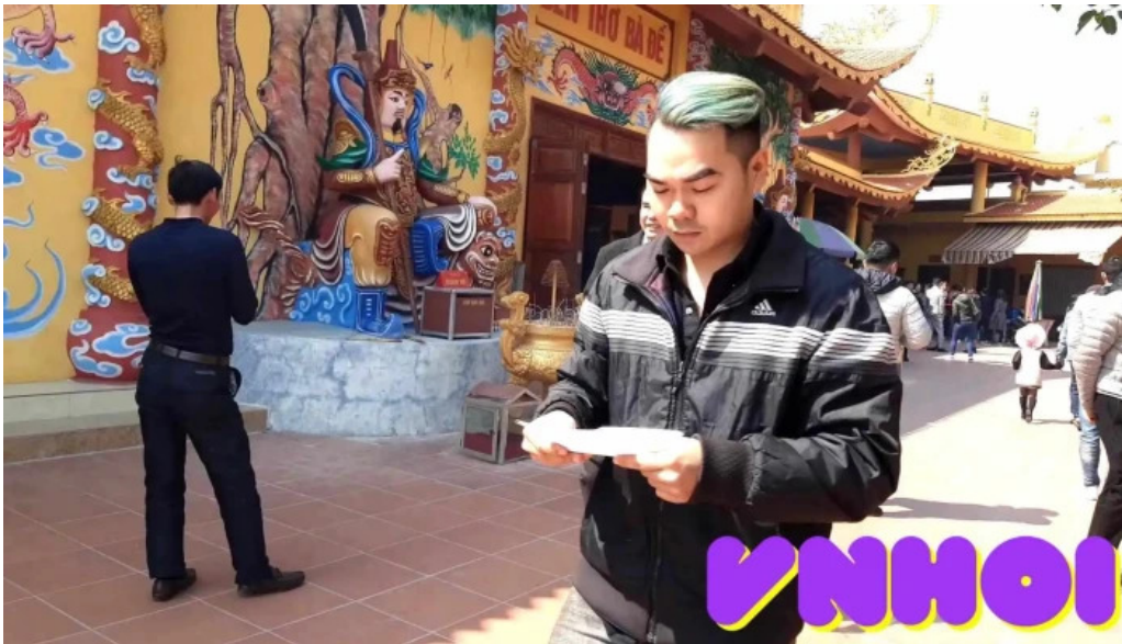
Den ba de video