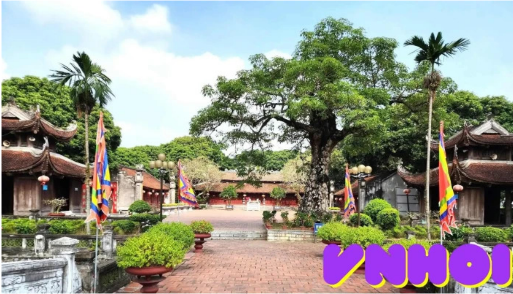
Van mieu mao dien tat ca