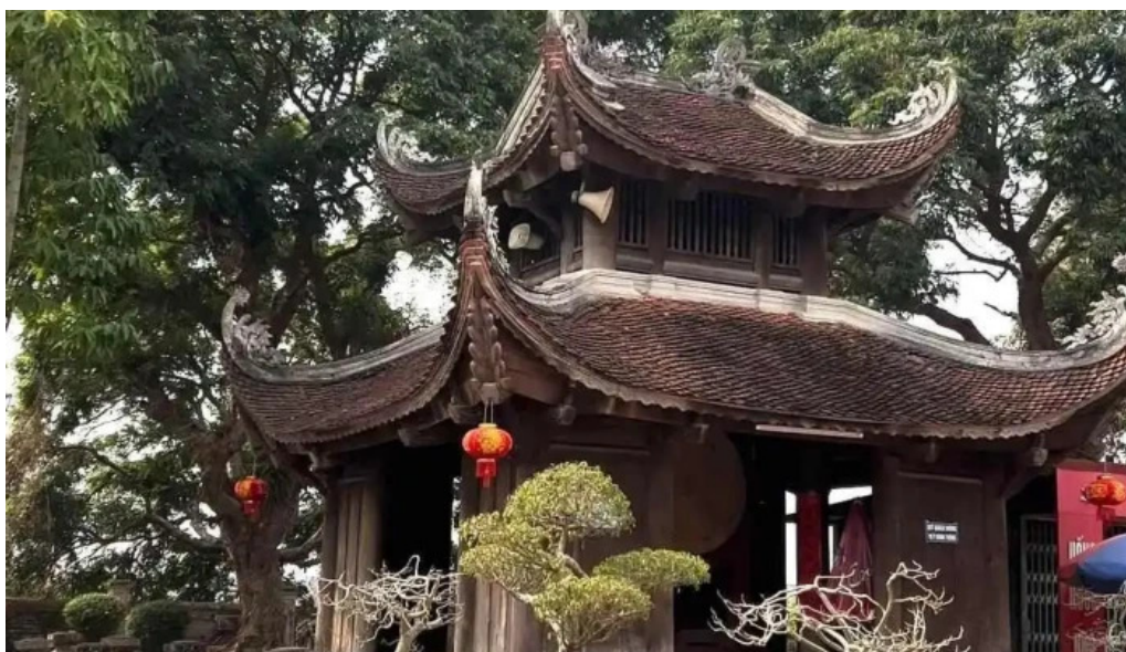
Van mieu mao dien video