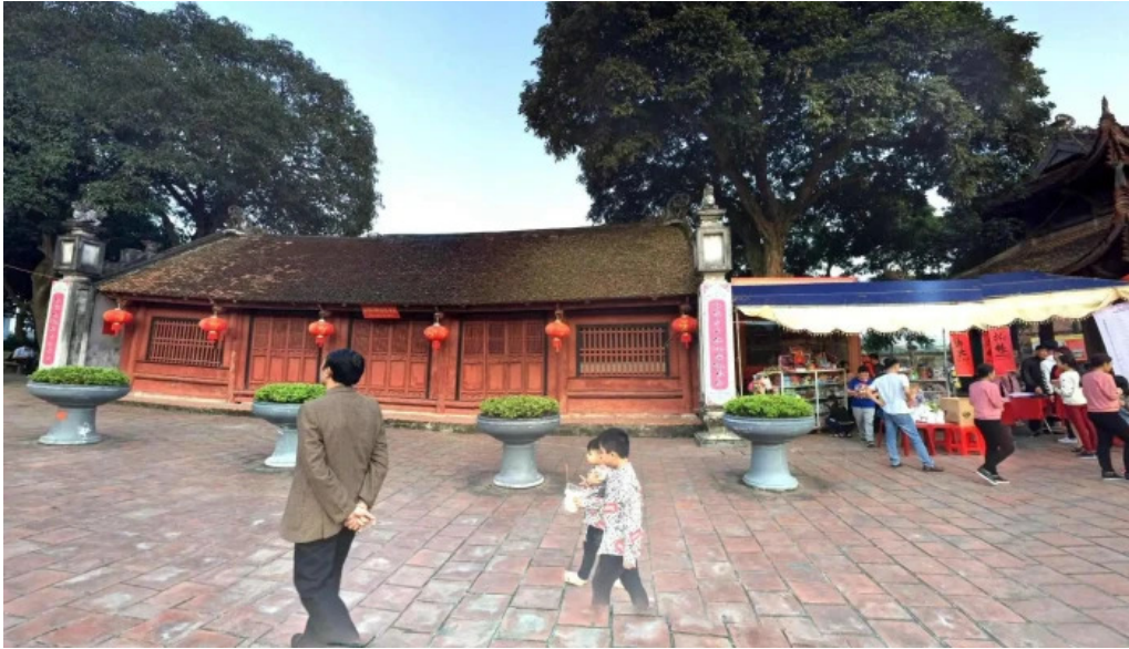
Van mieu mao dien che do xem pho va 360deg