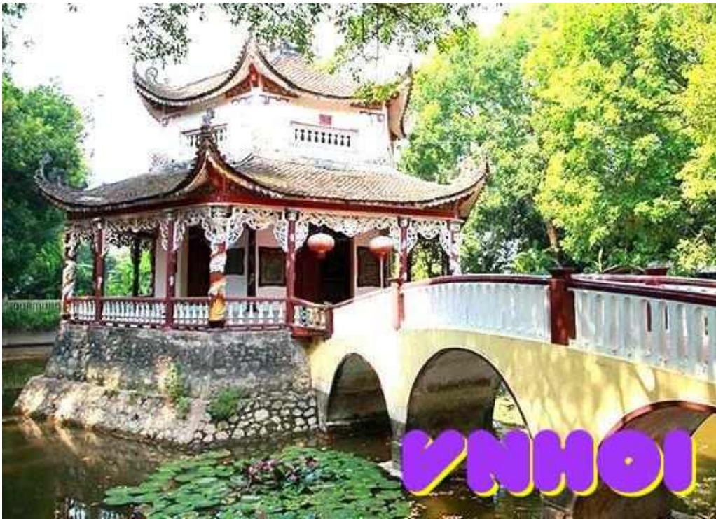
Den dam tat ca