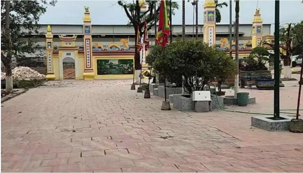
Den dam moi nhat