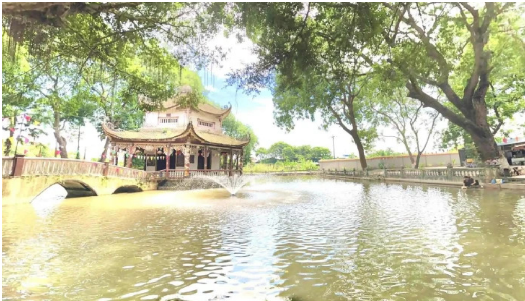
Den dam che do xem pho va 360deg