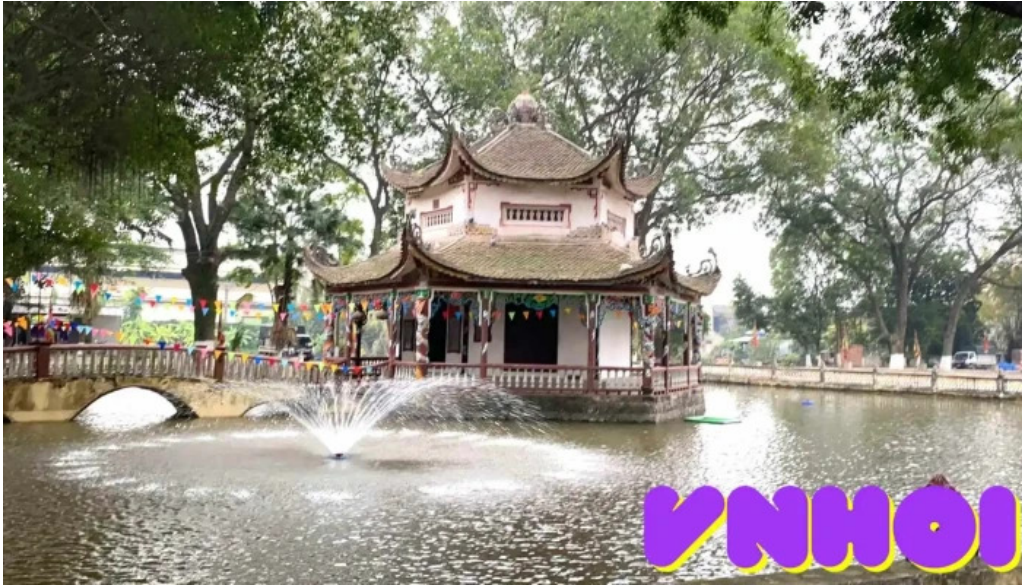
Den dam video