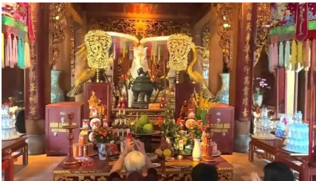
Den bach ma video