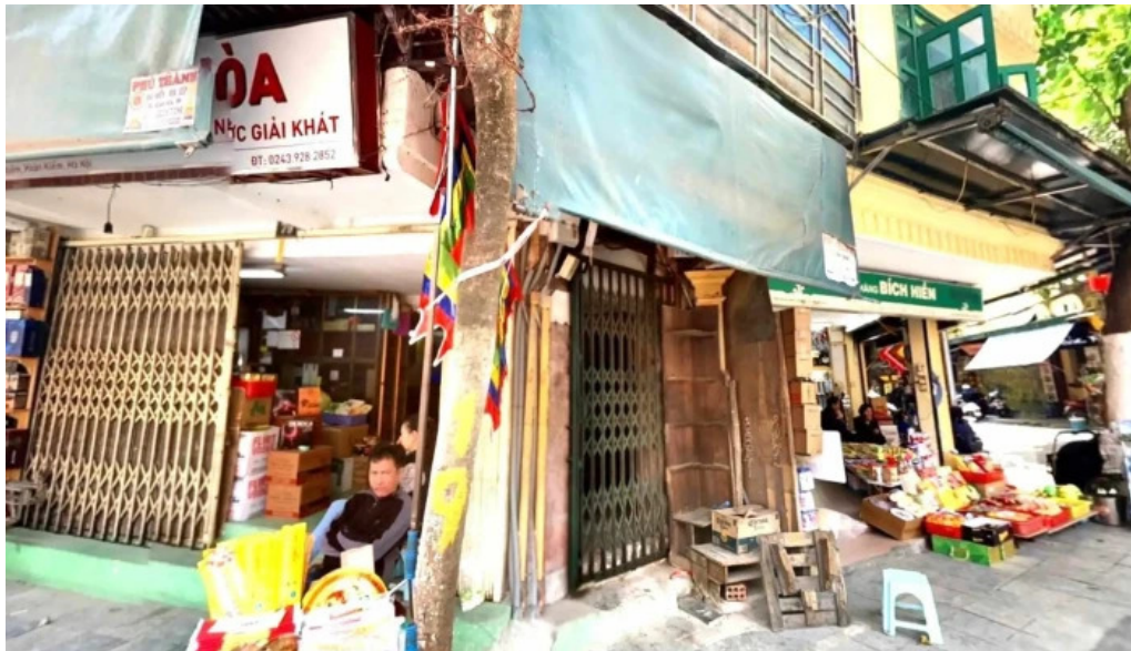
Den bach ma che do xem pho va 360deg