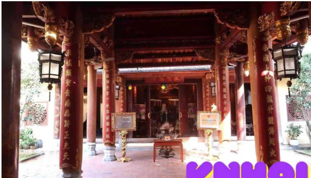
Den bach ma tat ca