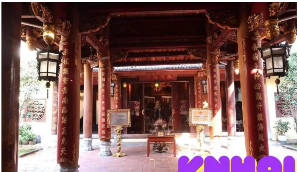
??n b?ch ma ha n?i