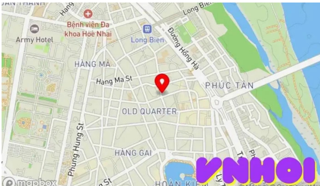
Den bach ma b?n ??