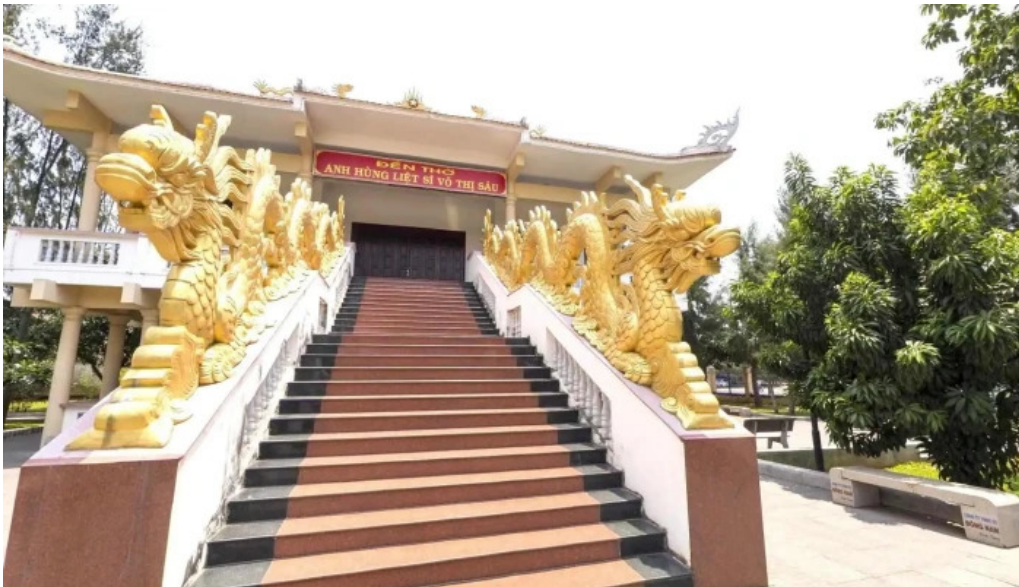
Den tho anh hung liet si vo thi sau che do xem pho va 360deg