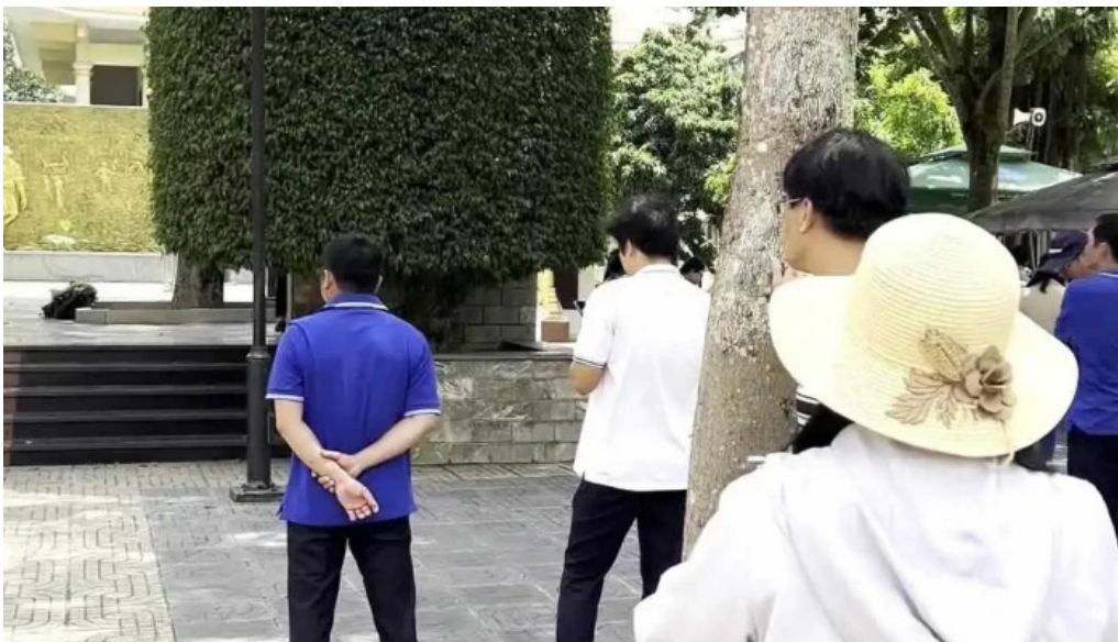
Den tho anh hung liet si vo thi sau video