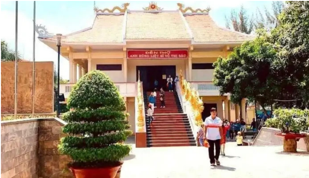
??n th? anh hung li?t s? vo th? sau ba r?a v?ng tau