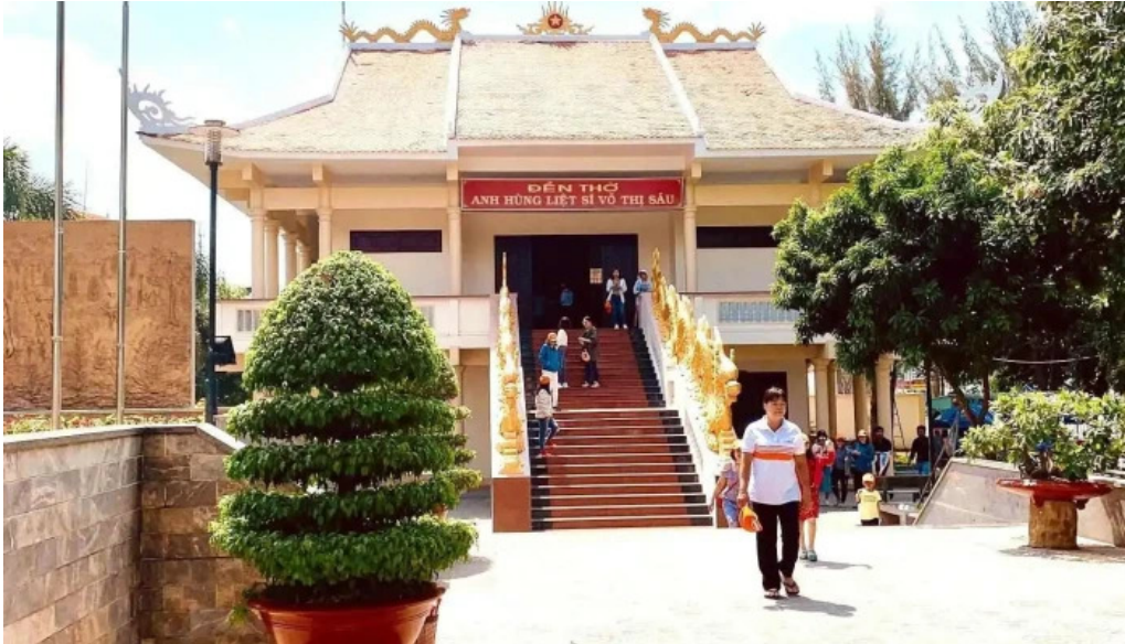
Den tho anh hung liet si vo thi sau tat ca