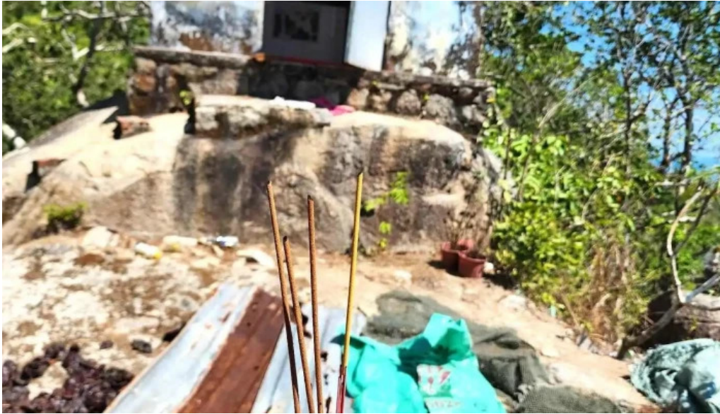
Núi kỳ vân tát ca