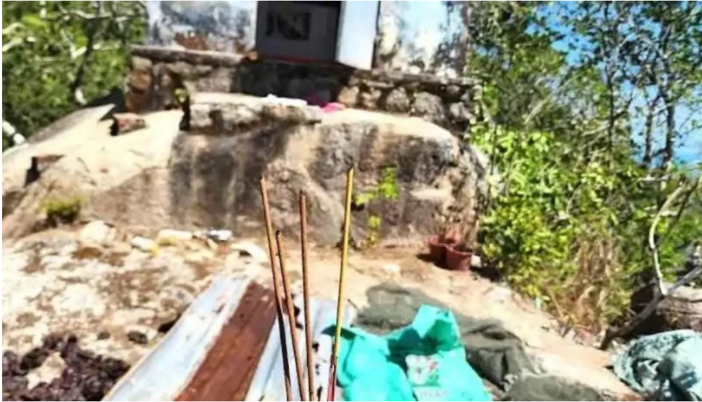
Nui k? van ba r?a v?ng tau