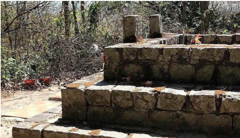
Nui ky van video