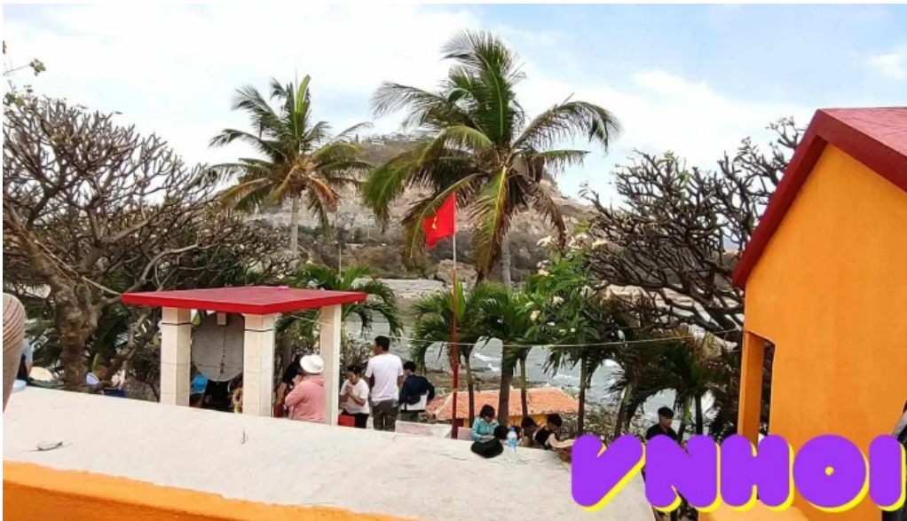
Ngu hanh mieu hon ba moi nhat