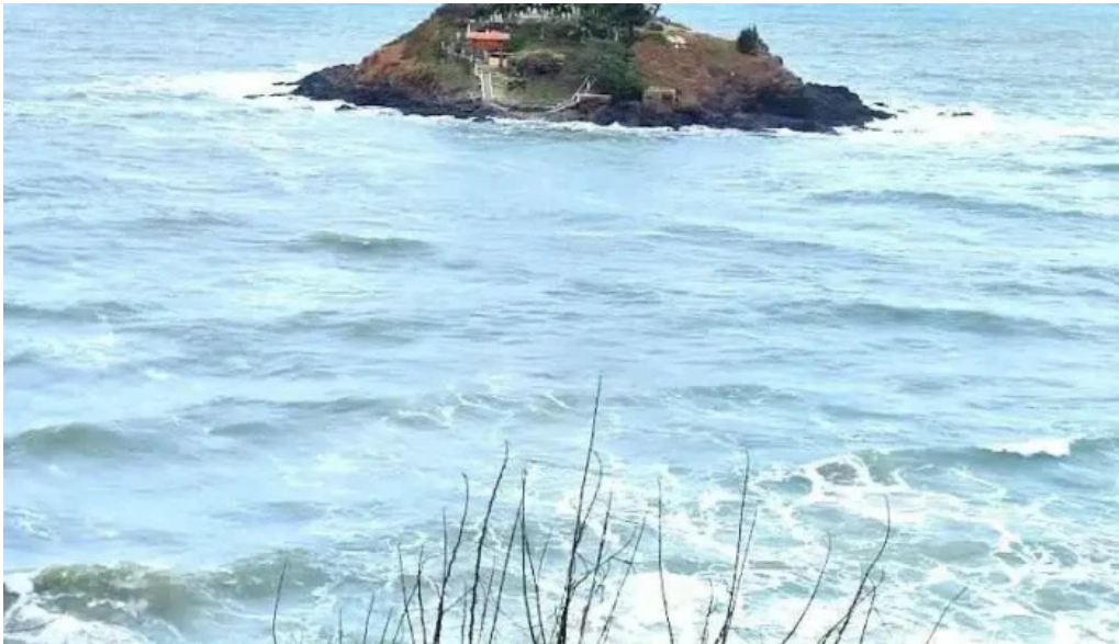
Ng? hanh mi?u hòn ba ba r?a v?ng tau