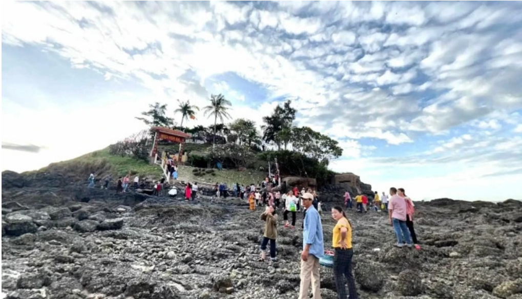
Ngu hanh mieu hon ba che do xem pho va 360deg