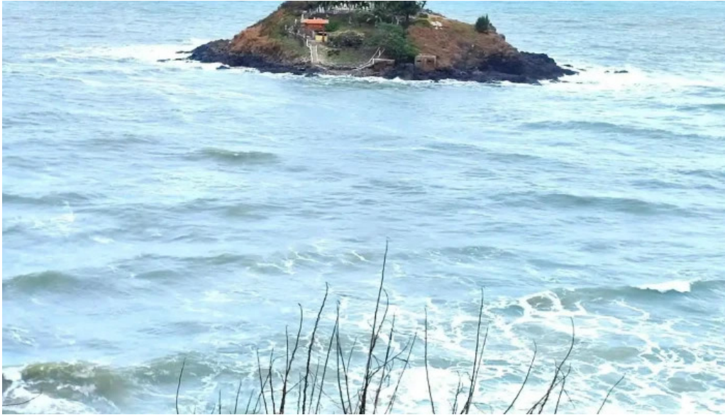
Ngu hanh mieu hon ba tat ca