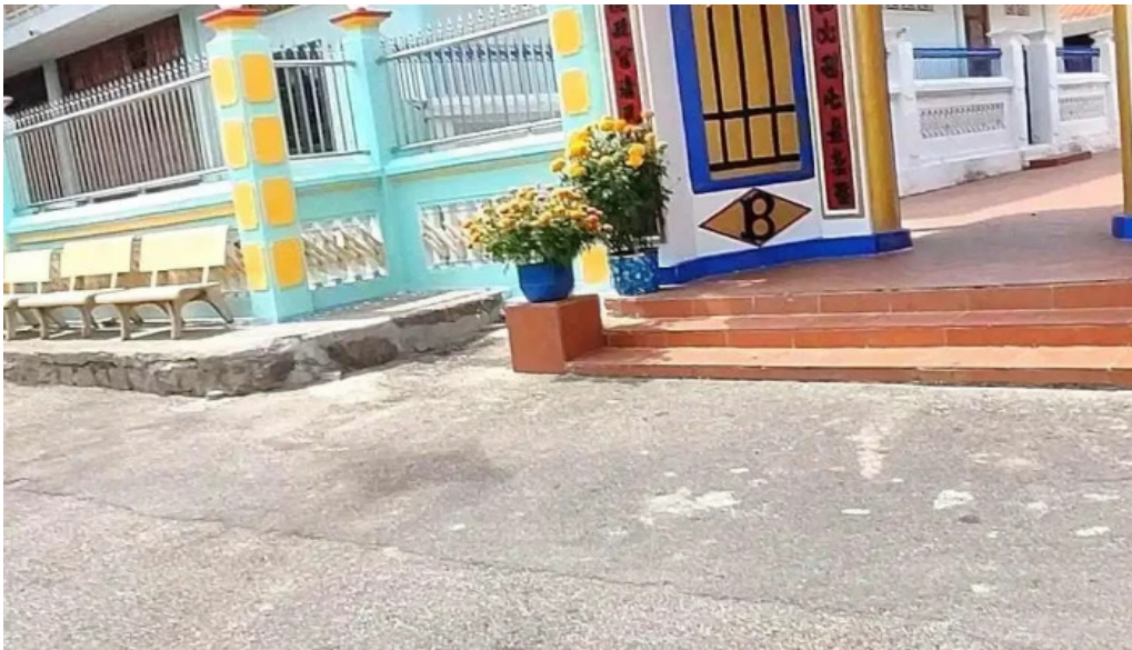
Di tích nhà lon video