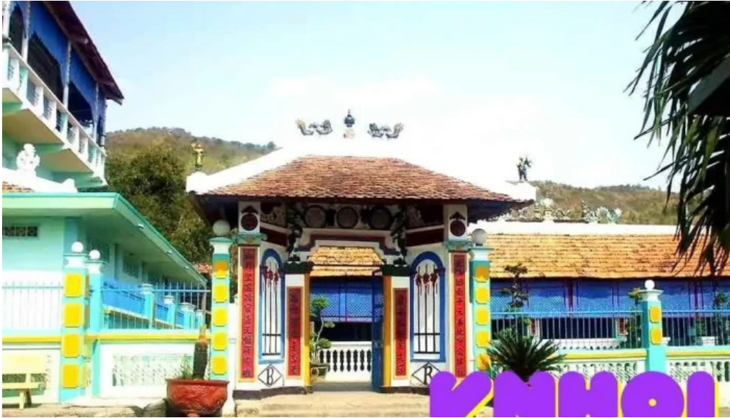
Di tích nha lon tat ca