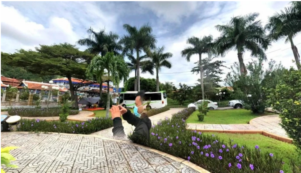
Di tích nhà lon che do xem pho va 360deg