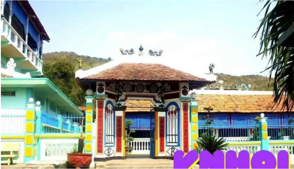
Di tích nhà lớn ba r?a v?ng tau