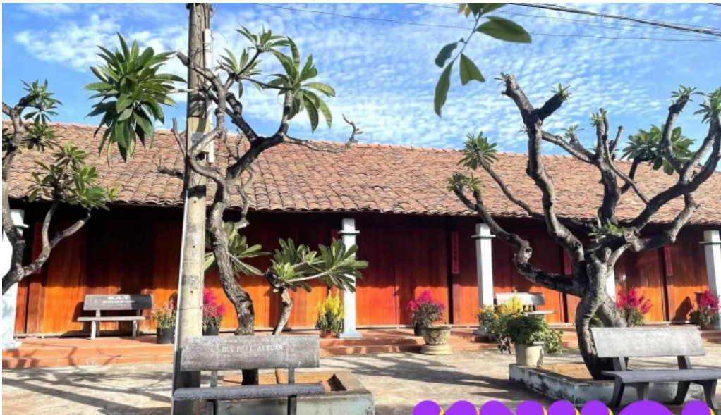
Di tích nha lon moi nhat