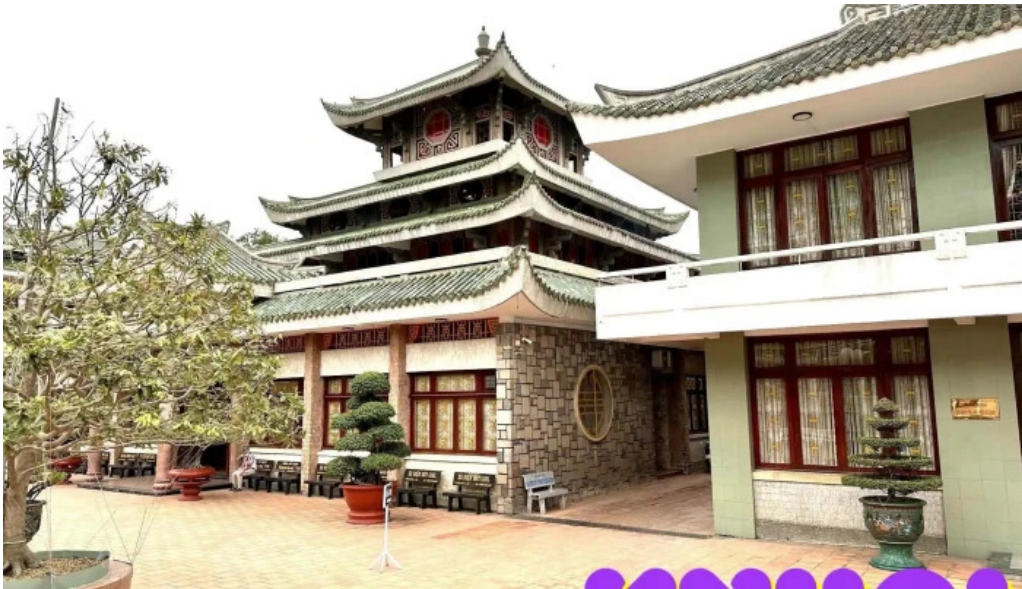
Mieu ba chua xu nui sam tat ca