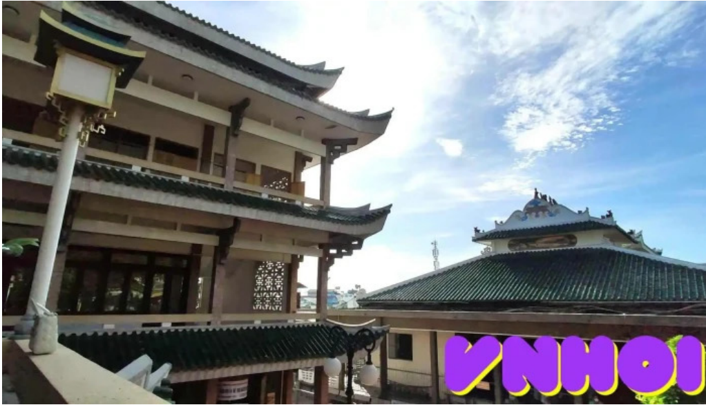
Mieu ba chua xu nui sam video