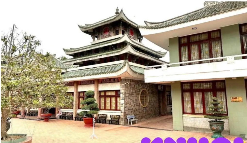
Mi?u ba chua x? nui sam an giang