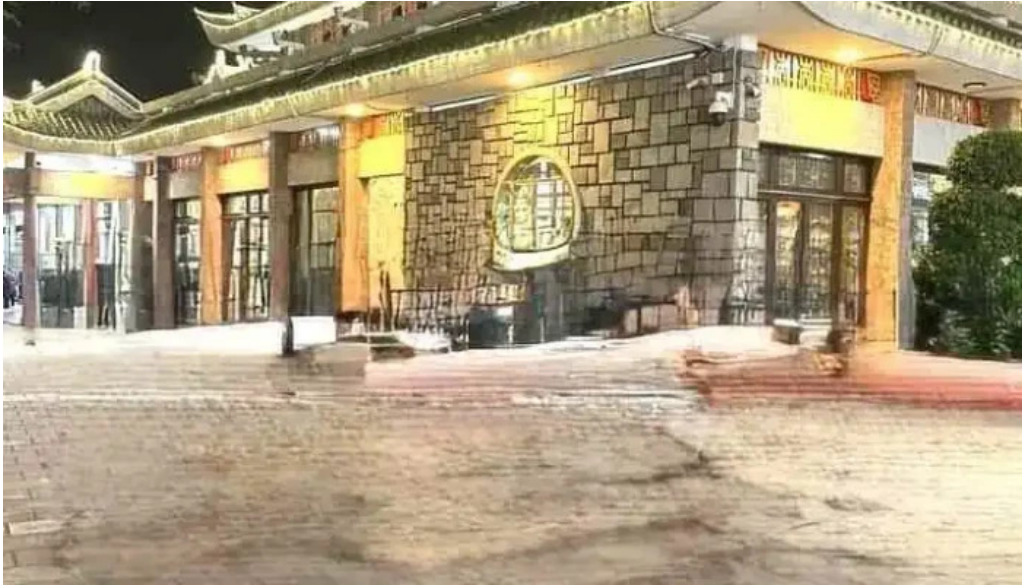
Mieu ba chua xu nui sam moi nhat