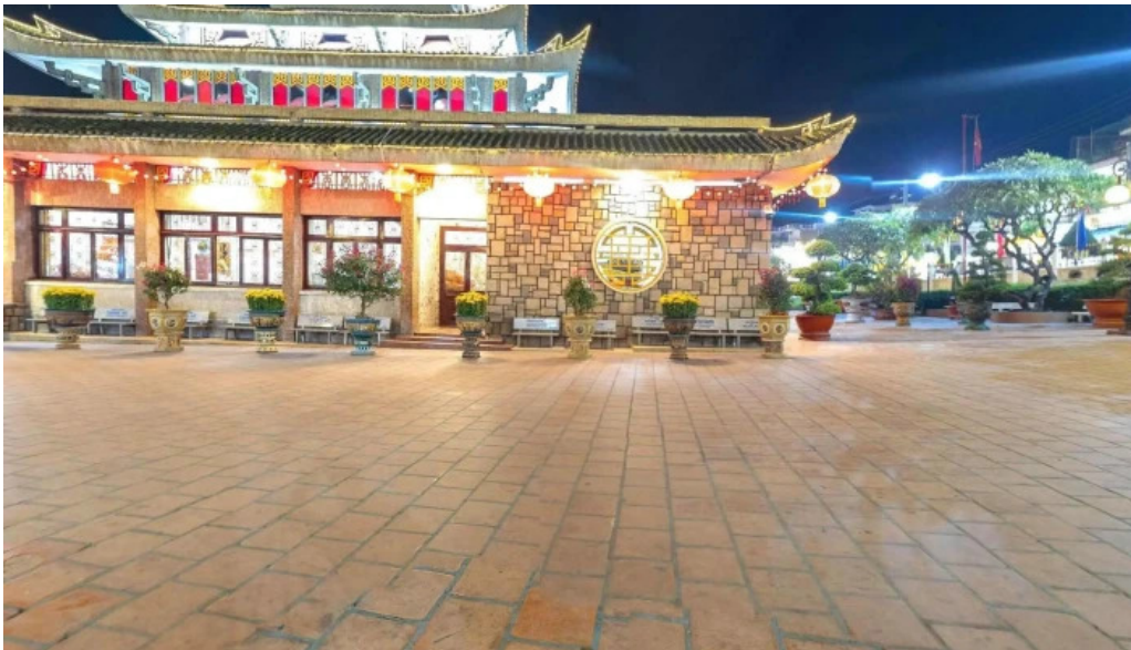
Mieu ba chua xu nui sam che do xem pho va 360deg