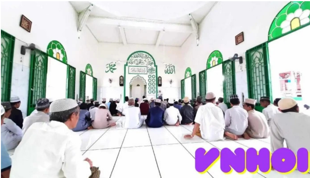
Thanh duong hoi giao jamuil azhar mosque cua chu so huu