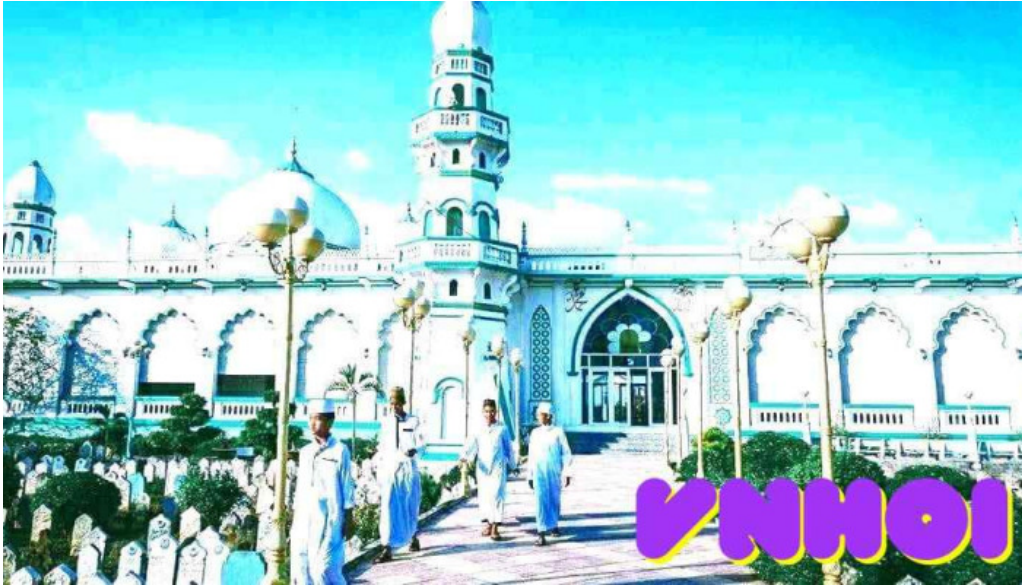
Thanh duong hoi giao jamuil azhar mosque tat ca