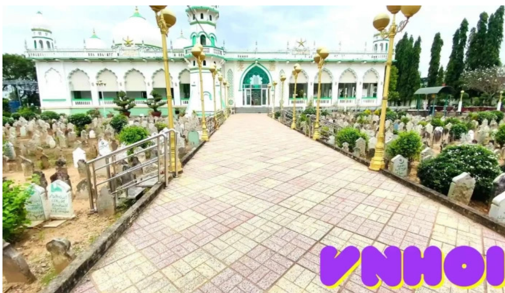
Thanh duong hoi giao jamuil azhar mosque video