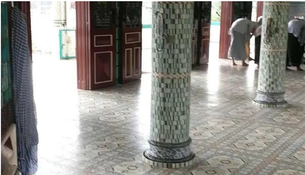
Thanh duong hoi giao jamuil azhar mosque moi nhat