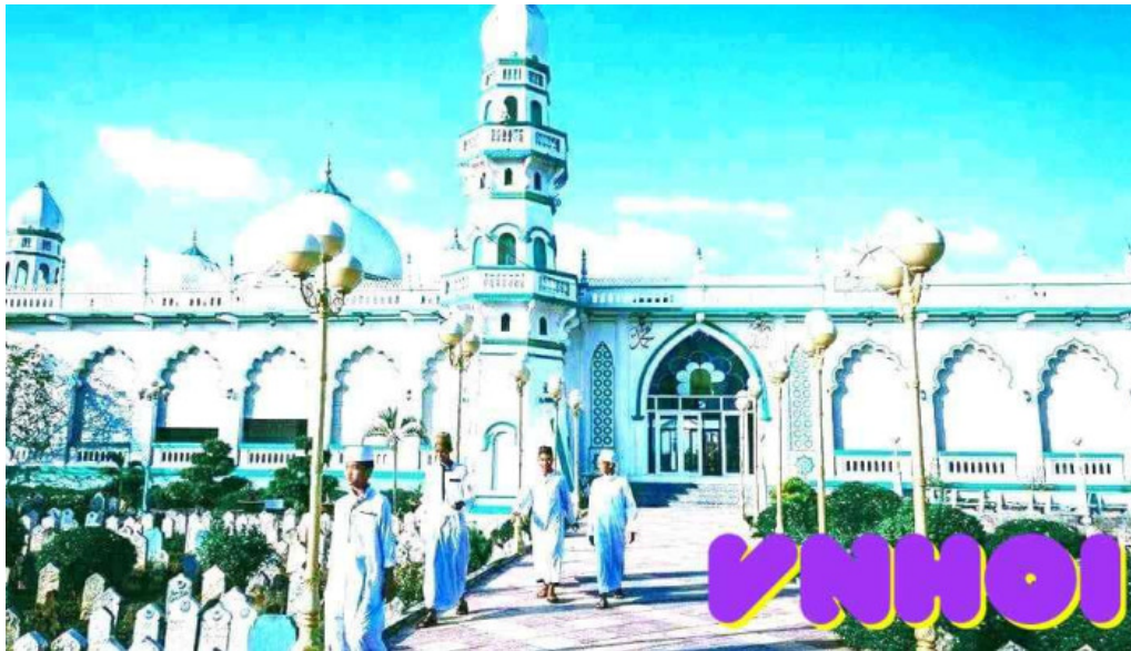
Thanh ???ng h?i giao jamuil azhar mosque an giang