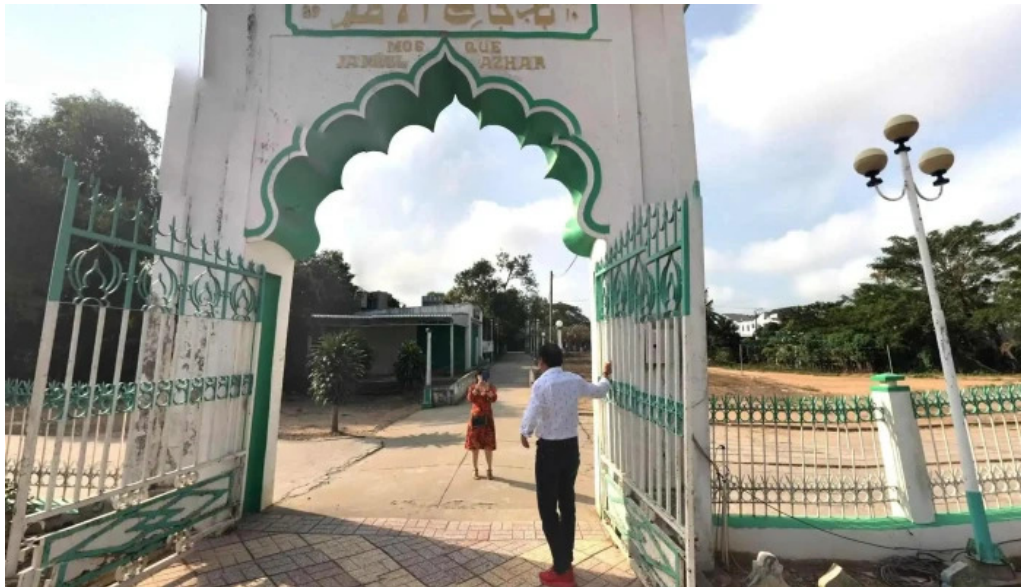
Thanh duong hoi giao jamuil azhar mosque che do xem pho va 360deg