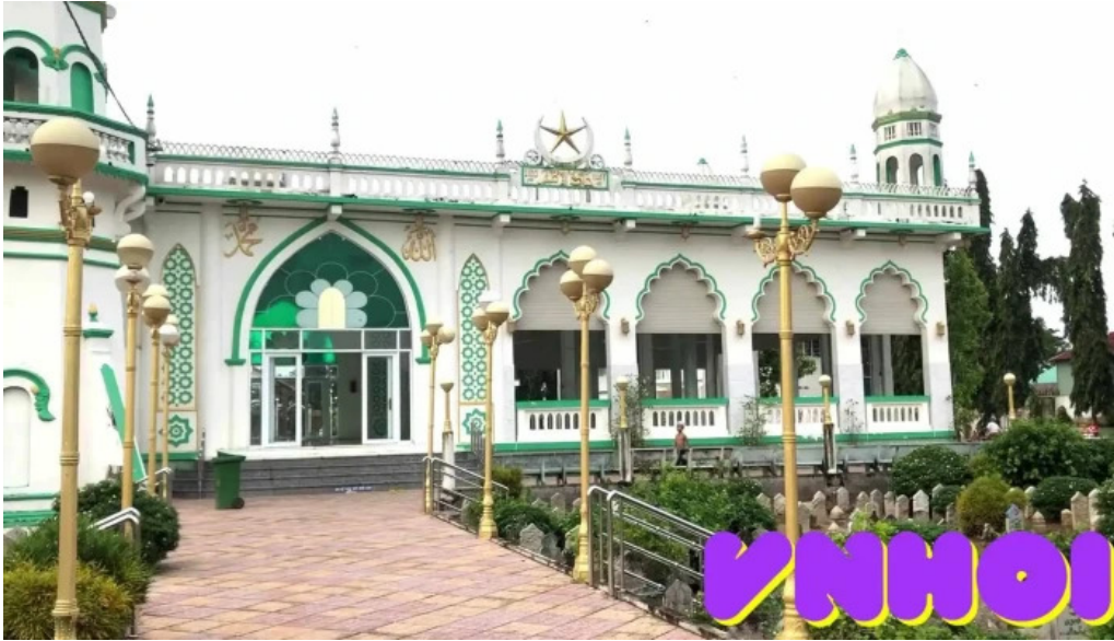
Thanh duong hoi giao jamuil azhar mosque kien truc vom