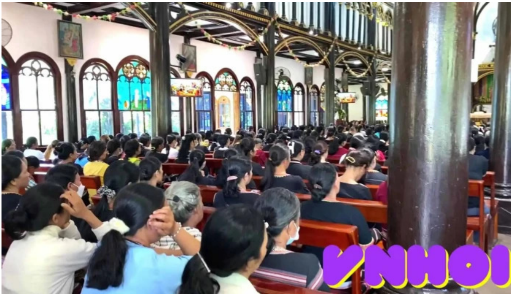
Wooden catholic church and cafe video