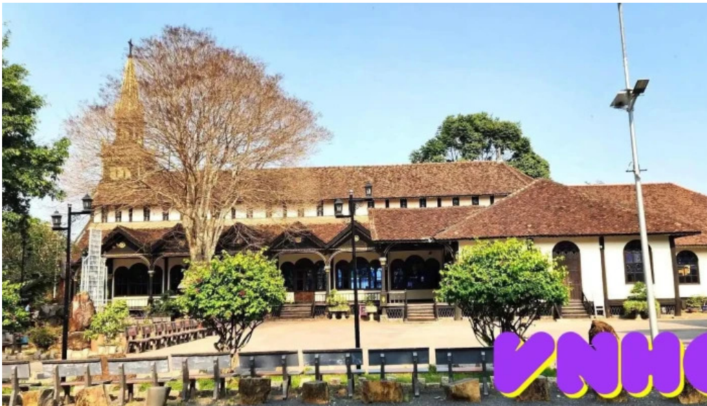
Wooden catholic church and cafe moi nhat