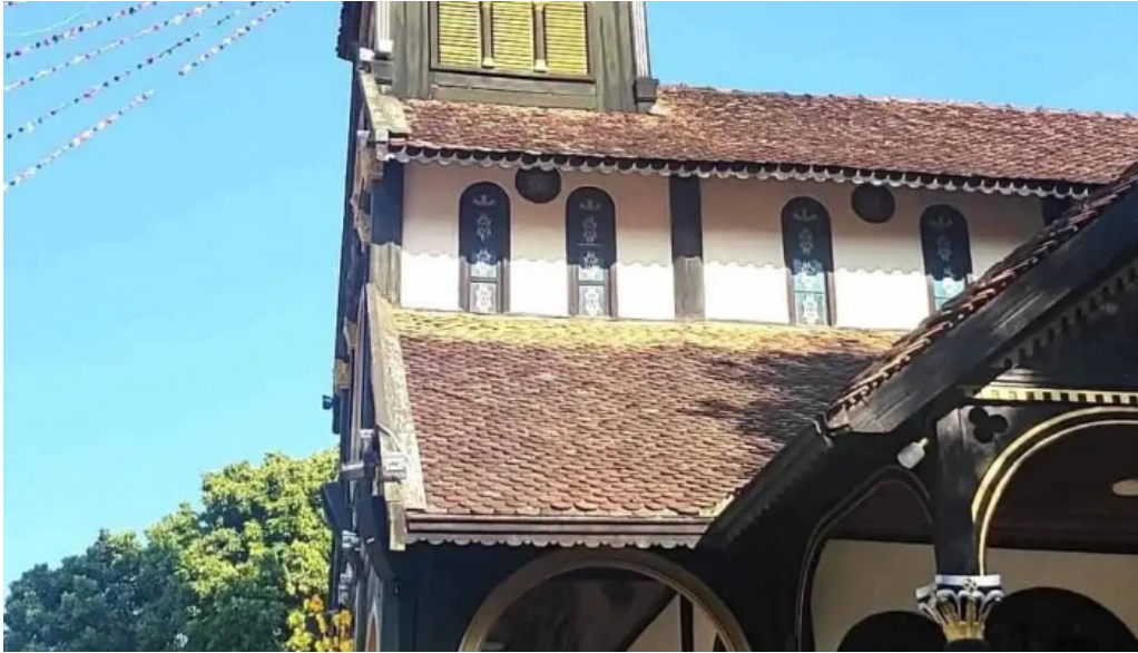
Wooden catholic church and cafe nha tho kito giao