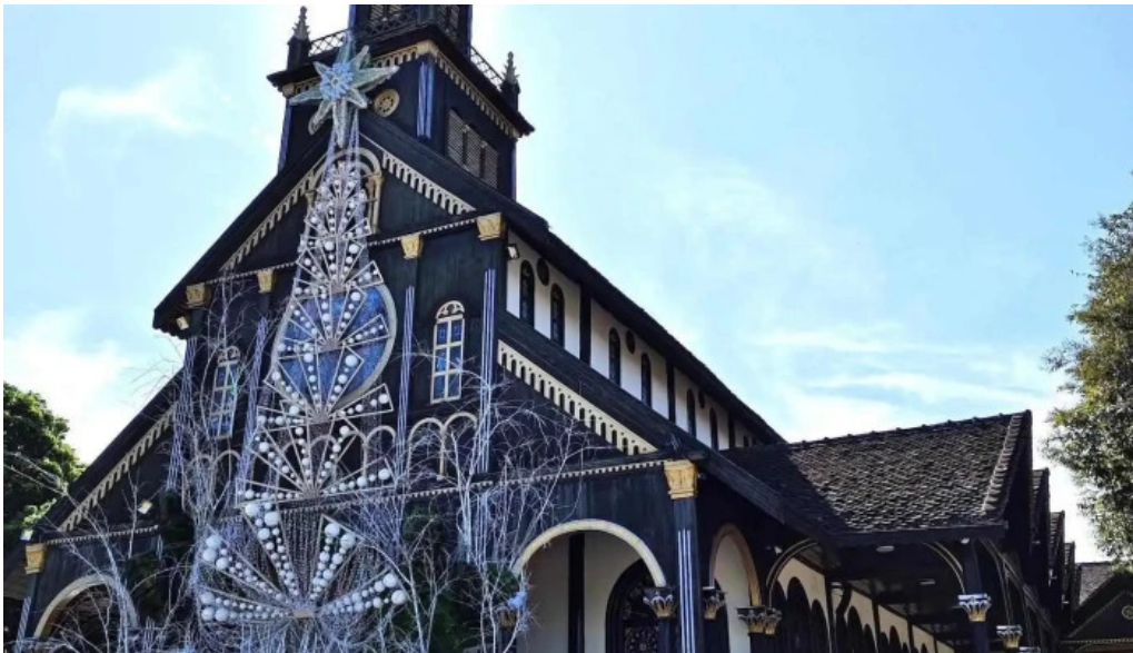
Wooden catholic church and cafe tat ca