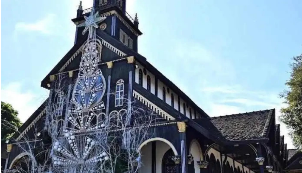
Wooden catholic church and cafe kon tum